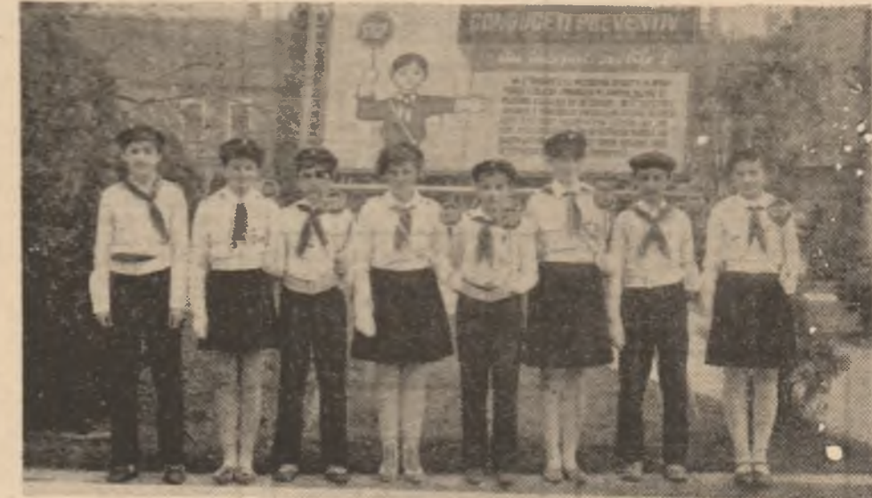
La Hațeg s-a desfășurat faza zonală a „Patrușelor școlare”, la care au participat patrușele de la școlile generale nr. 1 și 2 Hațeg, Sintămărie, Sarmizegetusa, Totești, Pul, Petros. Echipajul Șc. gen. nr. 2 Hațeg, format din 8 elevi și eleve, cls. a VII-a A, a ocupat locul I și va participa la faza județeană.

re întreprinderii. Paralel, se desfășoară cursul „Arta de a vinde”, în cadrul căruia economiști și merceologi din întreprindere predau ore unul număr de 30 de vizitatori pentru perfecționarea activității comerciale în fiecare magazin.