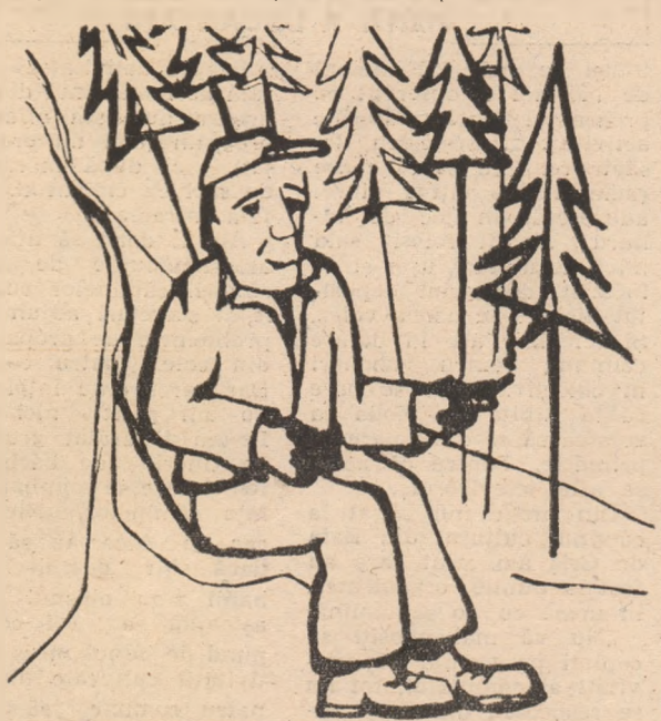
Fumatul este permis numai în locurile special amenajate în acest scop!

organizare a intervențiilor în caz de incendiu sau de alte calamități, de control și îndrumare a formațiilor de lucru din subordine. În acest context se cuvine subliniat faptul că un rol de maximă însemnătate îl au activitățile instructiv-educative pe care le întreprind lucrătorii din domeniul forestier — pădurari și brigadierii silvici —, consiliile populare și alți factori de răspundere din învățămînt, turism etc. În munca de educație pot și trebuie să fie folosite eficient stații-