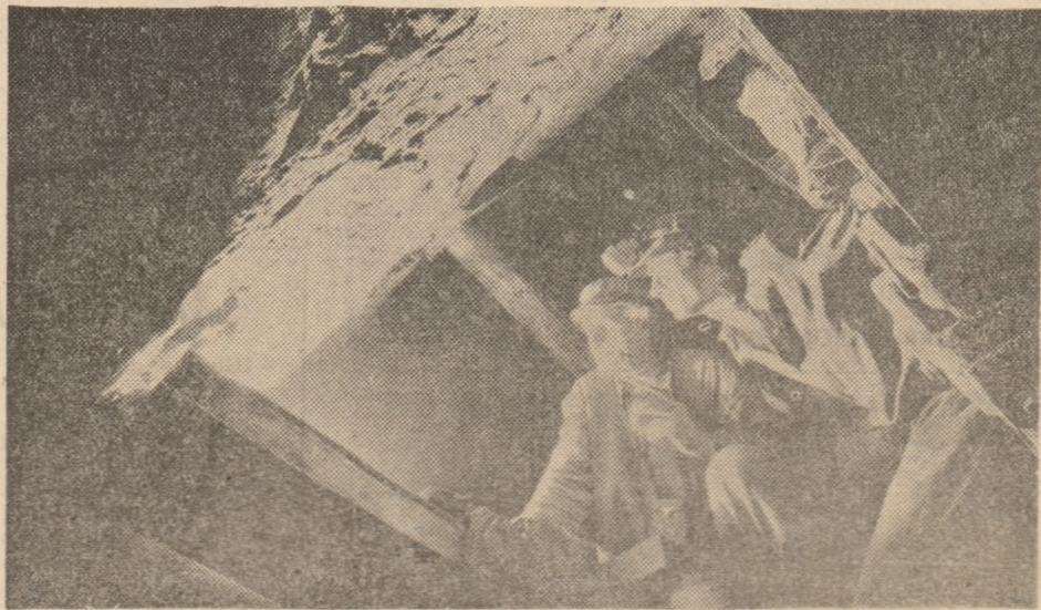
Aspect din munca minerilor de la întreprinderea minieră Petrila.