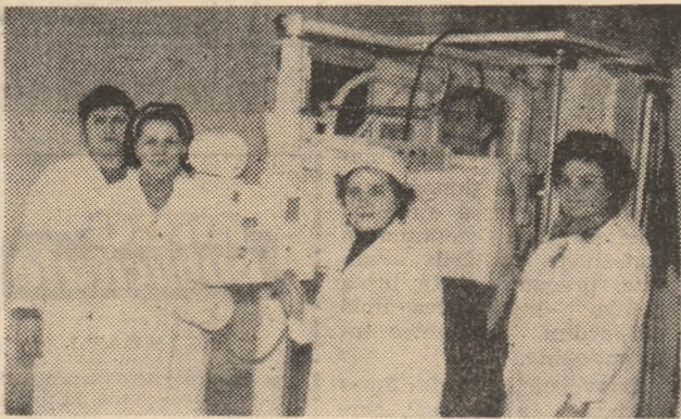
Policlinica municipiului Hunedoara. Colectivul secției de radio-fotografie medicală veghează cu răspundere la sănătatea oamenilor muncii.