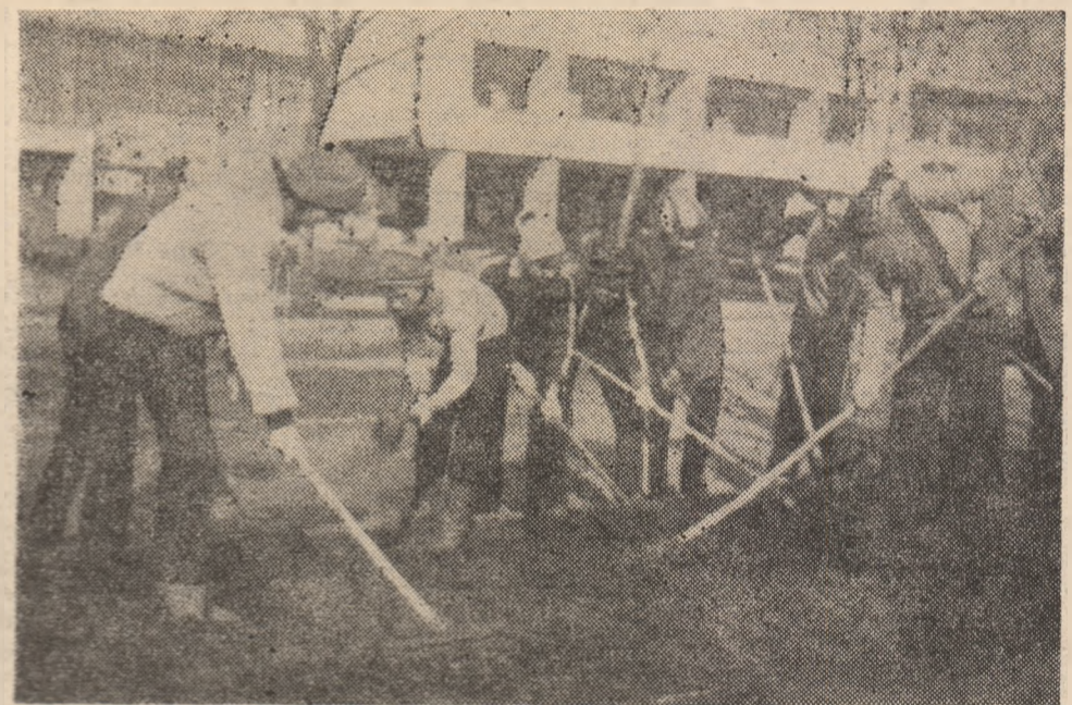
În nota obișnuită, adică de mare interes pentru aspectul orașului lor s-au prezentat duminică hunedoreni. Imagine de la acțiunile organizate pe bulevardul Dacia.

Grupaj realizat cu sprijinul corespondenților IOAN VLĂD și MIRON ȚIC