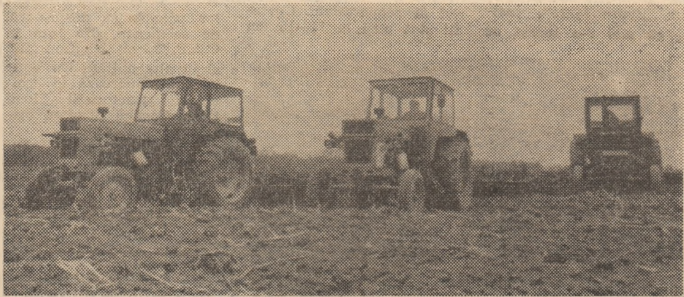
Mecanizatorii de la C.A.P. Romos au pregătit patul germinativ pe aproape întreaga suprafață destinată cultivării porumbului.