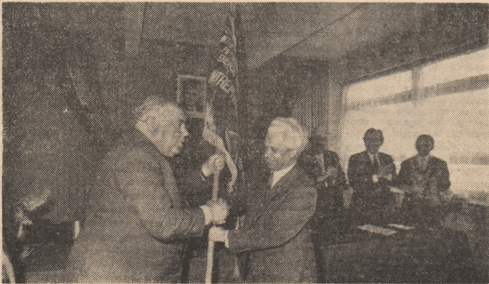
Aspect din timpul decernării drapelului.

pat muncitori, maiștri, ingineri, cadre cu funcții de răspundere de la C.T.E. Mintia, U.E. Poroșeni și C.T. Gurabarza, activiști de