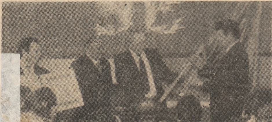
Aspect din timpul decernării drapelului.

Orăștie. Și aici ziua de simbătă a fost întrebunțată cu folos în scopul mai bune gospodării și infrumusețării a orașului. 150 de oameni ai muncii de la Întreprinderea „Chimica” și alți cetățeni au plantat trei pitici în incinta întreprinderii și pe străzile Barițiu, Căstăului și Kogălniceanu. Pe străzile Avram Iancu, Pricazului și Mureșul s-au efectuat lucrări de extindere a zonelor verzi și plantate, iar în Micro 2 s-au făcut nivelări după o seamă de lucrări edilitare.