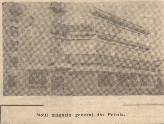
Noul magazin general din Petrila.