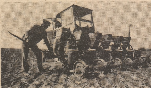
Pe ogoarele C.A.P. Birsău se lucrează intens pentru încheierea grabnică a însămînțării porumbului, lucrare pe care o realizează tractoristul Gavrilă Casvan.