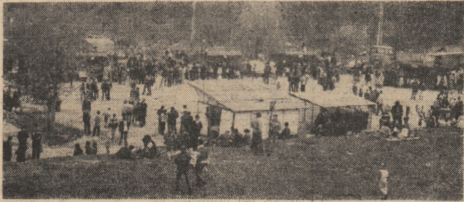
Deva. La pădurea Bejan.

1 Mai - o zi minunată în municipiul Hunedoara. O zi de adevărată sărbătoare. O zi în care oamenii au petrecut în voie de ziua lor, sărbătoarea muncii.