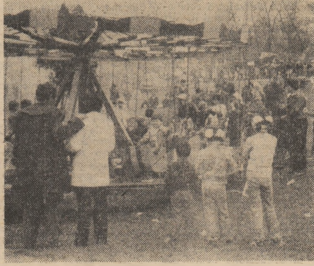
Bucuria copiilor la locurile de agrement.

● „Luna teatrului politic de amatori”. S-a încheiat, în aceste zile ale sărbătorilor de Mai, o nouă ediție a „Lunii teatrului politic de amatori” în care formații dramatice din numeroase cămine culturale au relevat potențele artistice și repertoriile de care dispun pentru o nouă și grăitoare prezență în festivalul muncii și creației „Cîntarea României”. O bună organizare a manifestării a demonstrat consiliul de educație politică și culturală socialistă Zam, unde s-au prezentat cu un re-