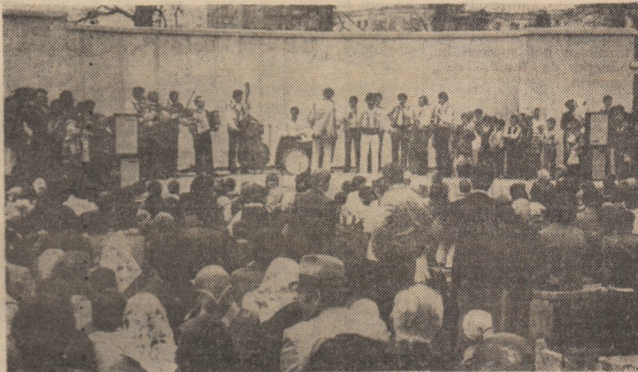
În zilele de 1 și 2 Mai, zonele de agrement și așezămintele culturale au oferit un bogat program de manifestări cultural-educative dedicate sărbătorii muncii. Aspect de la spectacolele desfășurate la pădurea Chizid, Hunedoara.