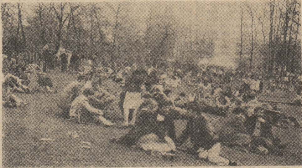
Hunedoara - la pădurea Chizid.

zului și ale după-amiezii zilelor de 1 și 2 Mai nu aveai loc să arunci un ac