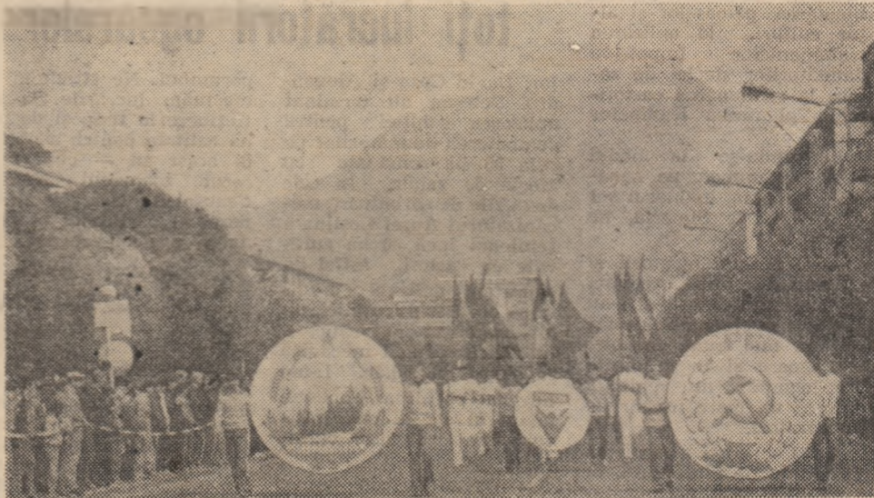
Aspect de la deschiderea festivă a celei de-a XVII-a ediții a „Crosului pionierului” și „Crosului tineretului”, care au avut loc duminică, 29 aprilie la Deva.