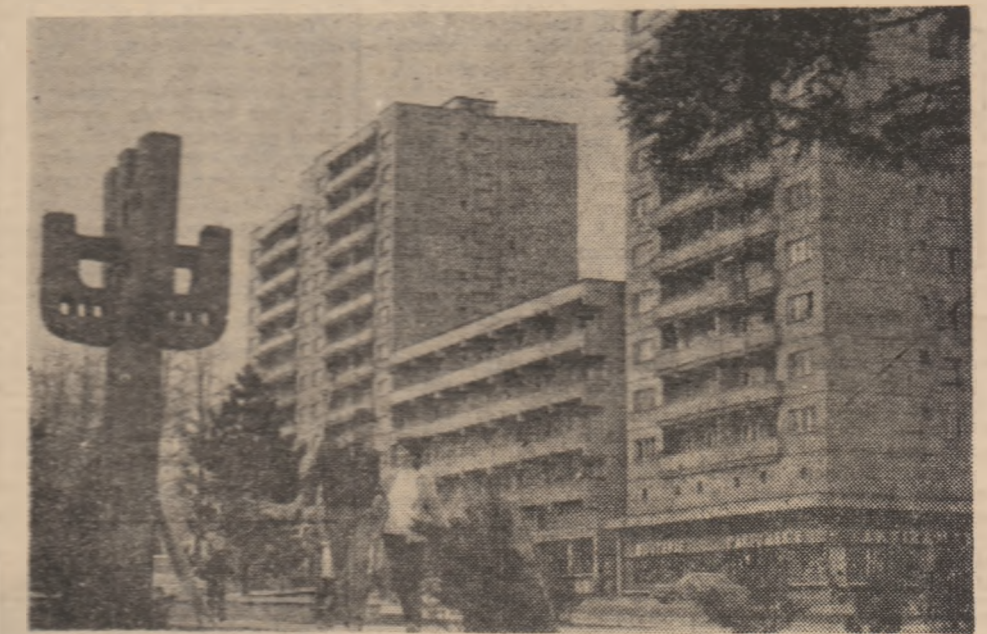
Pretinsanul, așa cum ne-a învățat să arate în ultimii ani, de cînd aici se conturează un oraș modern, schimbînd din temelii.