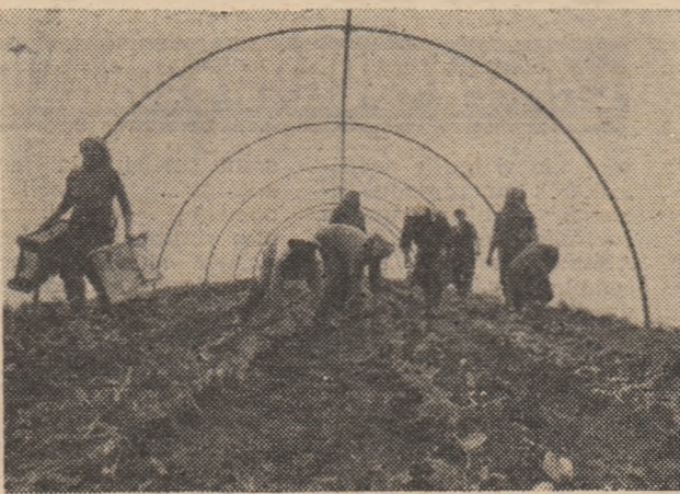
La A.E.S.C.H. Deva, ferma de solar, echipa nr. 2 condusă de Tălmăciu Georgeta desfășoară o activitate susținută pentru creșterea producției de legume.