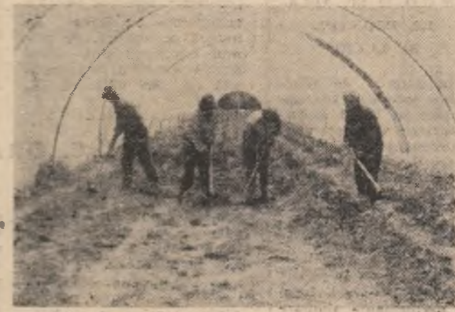
C.A.P. Geoagiu. Se pregătesc și se îngrijesc în solarii răsădurile de ardei pentru a fi cultivate în cîmp.

Trecînd înapoi, pe drumul Boia, ne-am deschis o clipă la școală. Aici întotdeauna s-au făcut numai patru clase și toți elevii, fiind puțini, se află într-o singură sală. Algebră, cum se știe, nu se învață nici în clasa a IV-a. Atunci, de unde ideea de a se da la copii nume „Minus“?! Să se fi bînuit, oare, încă din vechime că sub satul Boia sînt minereuri și că oamenii vor cobori cîndva să muncească la cote de a dîncime notate cu „Minus“?