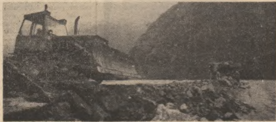
Se depun rocamente la viitorul baraj de pe Riu Mare-Retezat.

fost depășită cu 11,74 la sută, cheltuielile totale la „mie” au fost reduse cu 3,63 lei, iar cele materiale