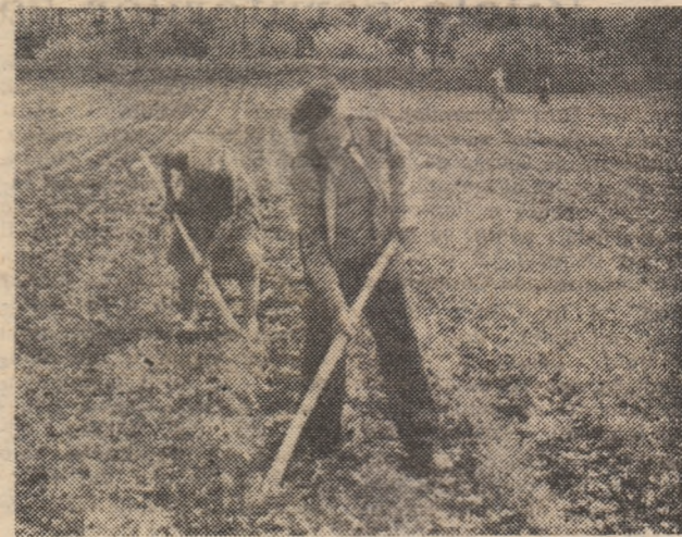
C.A.P. Peștișu Mic. În aceste zile se lucrează la prașitul sfeclii furajere.