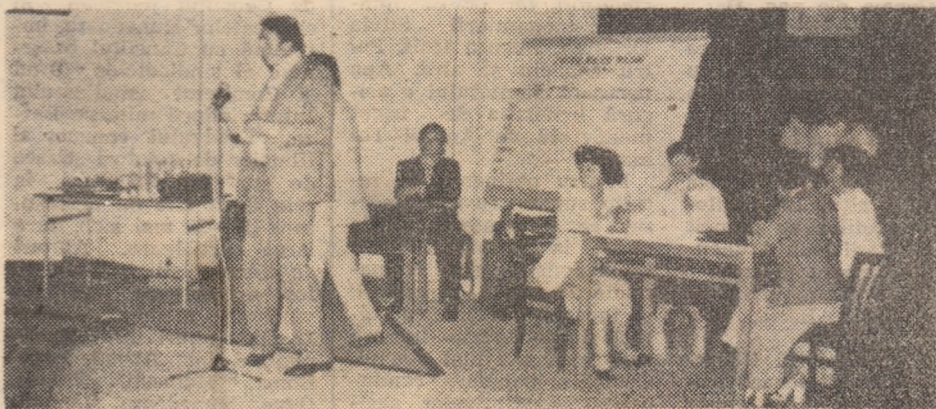
În concurs: echipajul comunei Băcia.