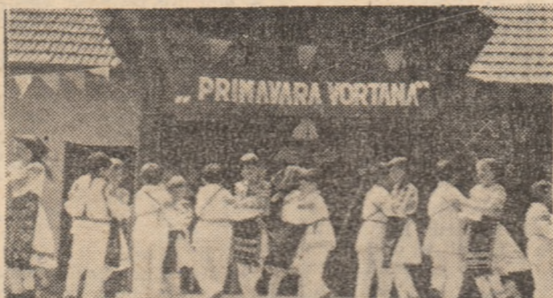
El vor duce peste ani tradițiile spiritualității locuitorilor Vorței.