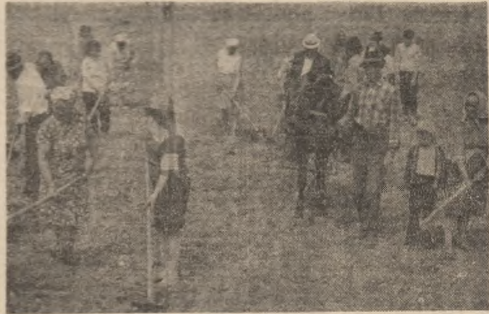
C.A.P. Pui. Participare numeroasă la întreținerea culturilor.

— Am organizat echipe complexe de întreținere și reparații în scopul asigurării unor intervenții optime la utilaje, în special la mori. Simultan, a fost pregătit tot stocul necesar de piese. Pe traseul cărbunelui — în afară de amenajările deja cunoscute — avem în curs de execuție, cu termen de finalizare în noiembrie 1984, un flux suplimentar de alimentate cu cărbune pe partea blocului nr. 6. Acesta va crește cu sută la sută siguranța în funcționare a tuturor blocurilor.