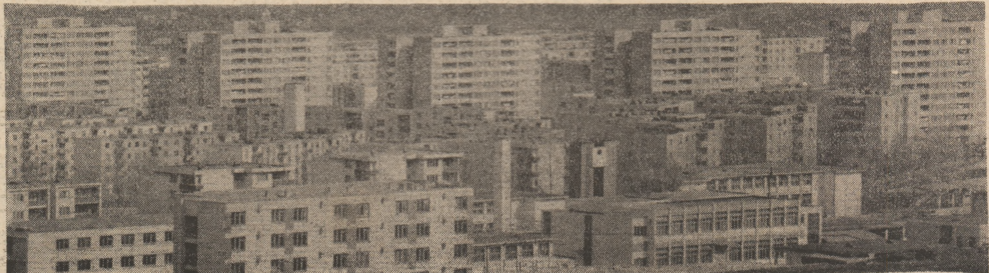
DEVA — dezvoltare urbanistică fără precedent.