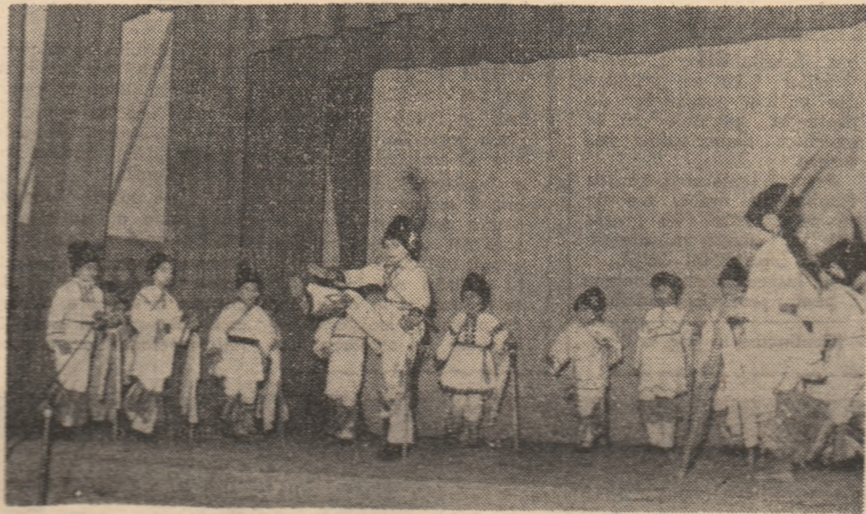
Speciacoal prezentat de Ansamblul orășenesc al pionierilor și șoimilor patriei din Orăștie (formația de călășari a Școlii generale nr. 2), sub genericul „Cinstim patria, partidul și poporul”.

Clubul „Pionierul” Hunedoara, în echipă mixtă cu C.S.Ș. Hunedoara — locul IV la faza republicană a „Cupei Pionierul”.