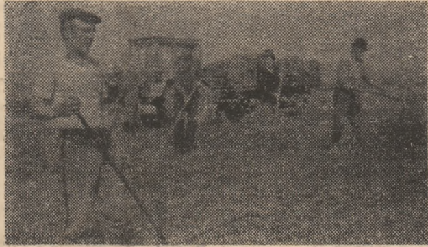
A.E.I. Băraști. La stringerea furajelor masă verde sînt mobilizați și cosășii.