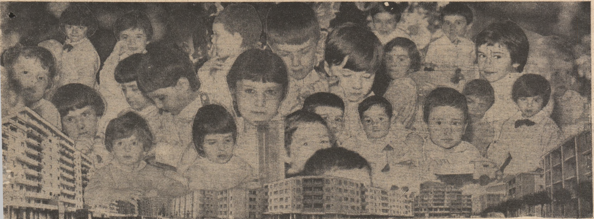
„La mulți ani” copilărie fericită!