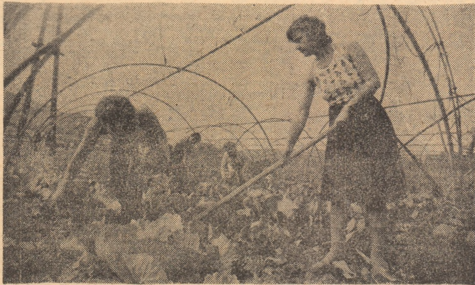
La solarile C.A.P. Erad s-a realizat prășitul culturii de varză timpurie.

pregătiri și în C.A.P., unde s-au curățat și dezinfestat spațiile de depozitare, astfel încît — așa cum a cerut secretarul general al partidului — recolta și semințele să fie depozitate și păstrate în cele mai bune condiții. Un accent de seamă va fi pus pe stabilirea judicioasă a formațiilor de cooperatori care vor lucra la stringerea și înmagazinarea recoltei, pe buna organizare a muncii și respectarea programelor de lucru întocmite în fiecare unitate pentru campania de seceriș.