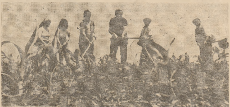
În tarlă „Dimpu Gothății” a A.E.I. Ilia, au participat la efectuarea prașilei manuale la cultura porumbului și lucrătorii de la C.L.F. din localitate.