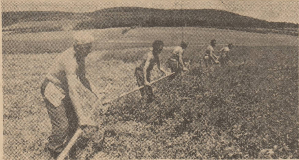
Cosașii lucrează cu spor la recoltatul manual al lucernel de pe terenul A.E.I. IIIa.