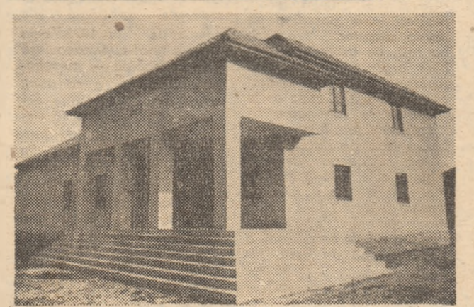
Noul cîmin cultural din satul Luncolu de Sus, construit prin hărnicia localnicilor.