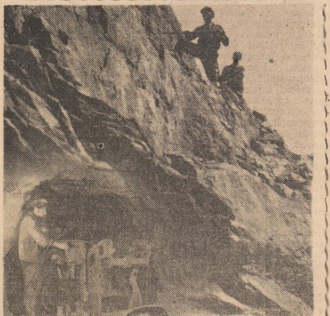
Aspect din munca explorărilor