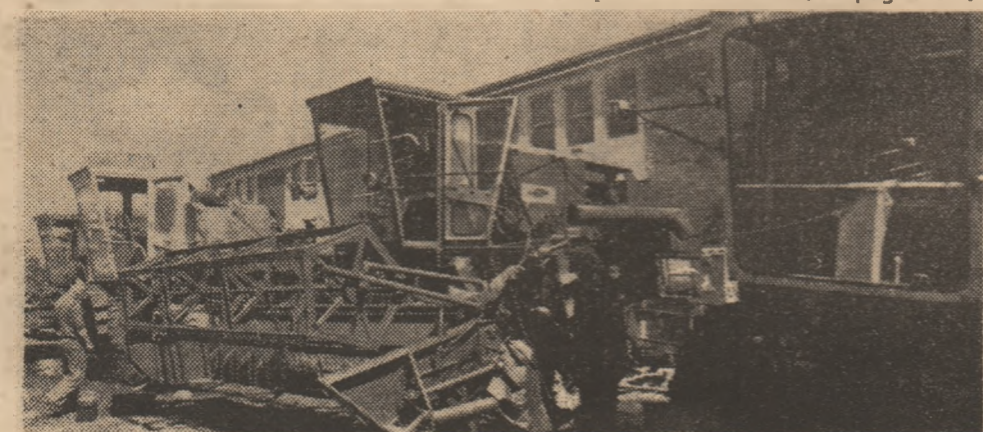
Gata pregătite, combinele de la S.M.A. Iliș așteaptă începerea bătăliei pentru strîngerea recoltei de cereale păioase.