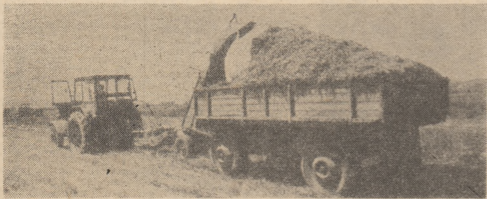
La Asociația economică intercooperatistă Grind se lucrează intens la insilozarea furajelor, pînă acum fiind realizate peste 1800 tone nutrețuri insilozate.