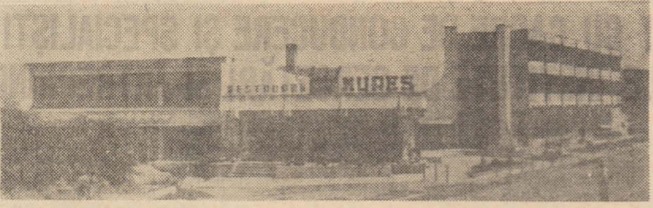
Imagine din noua zestre edilitară a comunei Ilia.

Comuna Ilia se înfățișea- ză azi ca o localitate în continuă ascensiune.