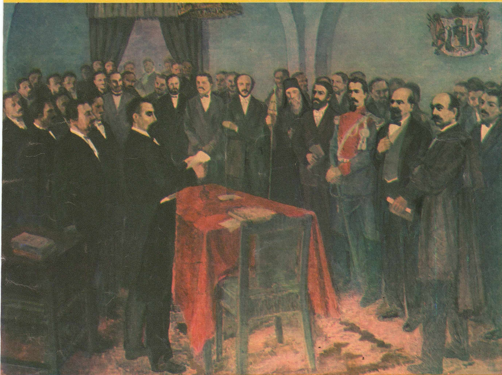
Pictură de M. CAMĂRUȚ — lucrare a Muzeului Unirii-Iași