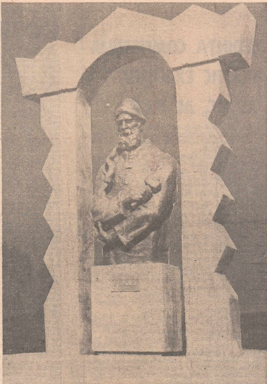
Un sculptor de azi își omagiază un mare predecesor: C. Brâncuși în viziunea lui I. Irimescu

Săptămînal editat de Frontul Unității Socialiste