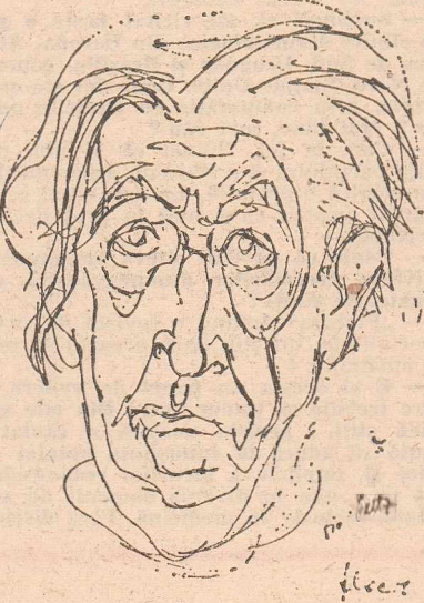
Desen de TIA PELTZ ■

Isac Peltz s-a născut la 12 februarie 1899 în București. Bibliografie selectivă: Menirea literaturii (1916), Stafia roșie (1918), Mesterul viață (1918), Fiori (1919), Fantome vopsite (1924), Viața cu haz și fără a numitului Stan (1929), Horoscop (1932), Amor incuiat (1933), Calea Văcărești (1933), Foc în Hanul cu tei (1934), De-a bușilea (1936), Actele „vorbește” (1936), Noptile domnisoarei Mili (1937), Pui de lele (1937), Tară bună (1937), De-a viața și de-a moartea (1939), Izrael însingurat (1945), Max și lumea lui (1957), Inimi zbuciumate (1962), Fauna burzuluiilor (1965), Instantanee comice și nu prea (1967), Microbar (1971), Amintiri despre viața literară (1974)