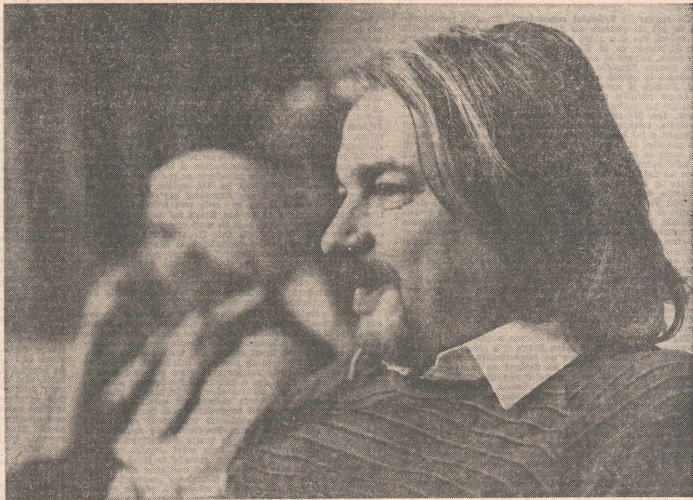
Fotografie de VICTOR RADULESCU

— În mod sincer, nu cred că există un timp al poeziei. Poezia e singura pricină exprimată sau neexprimată care îl dă omului dorința de a mai trăi în continuare. Poezia e sentimentul fundamental care îndreptățește specia umană. Să nu ți se pară că fac o afirmație categorică. Absența poeziei din sufletul omului neîndreptățește specia umană, îndreptățește însă agresunea speciei. Cu riscul de a mă repeta, melancolic remarcă a nu știu cîta