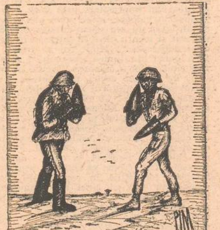
MIHAI PINZARU-PIM ■