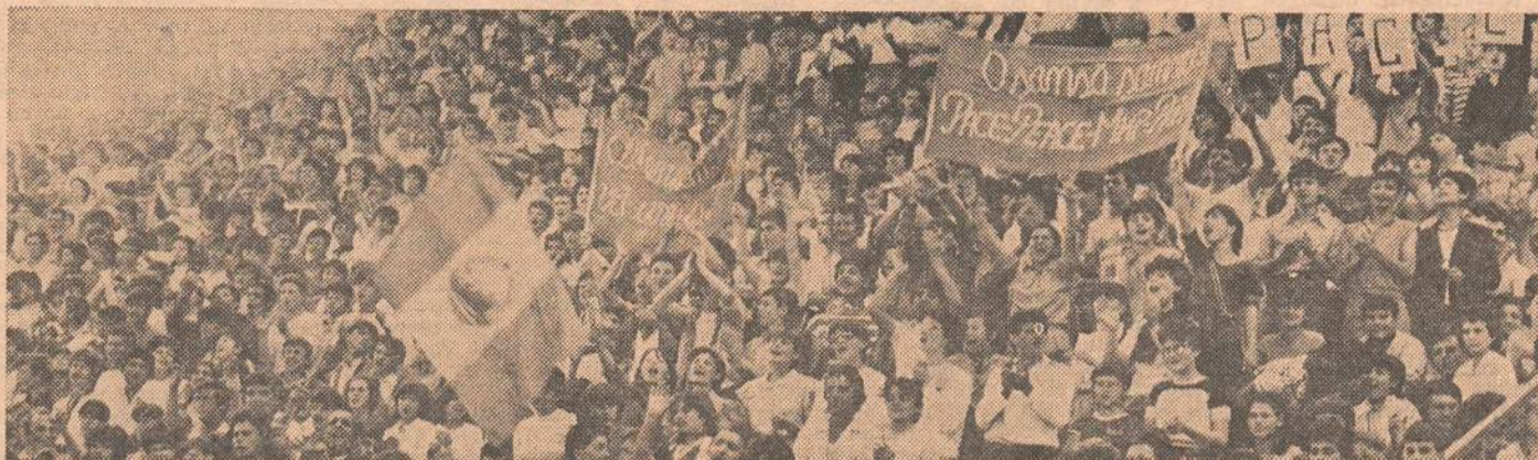
Tirgu Jiu, într-o sugestivă imagine a spiritului revoluționar și a tineretului triumfătoare