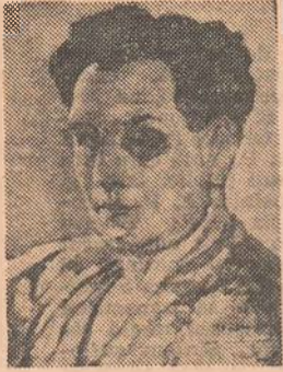
Tonitza. Studiu de autopoartret

Tonitza e uneori un pedagog prea intransigent. Crede că un copil care tură păpușo cu sfocă de la zmeul vecinului de joacă sau elevul care, strigat la lecție, trage cu urechea la ce i se suflă din bancă, sau acela care a copiat la o teză fără să roșească, sint cu toții „mici răsaduri de viitori mari hoji ai societății”. Nu mă pot opri să zimbesc vinovat citind aceste rânduri. Cum se face oare că n-am devenit un delinvent incurabil și că am scăpat de rigorile dreptului penal? Probabil, mă număr printre acei norocoși, de care vorbește tot To-