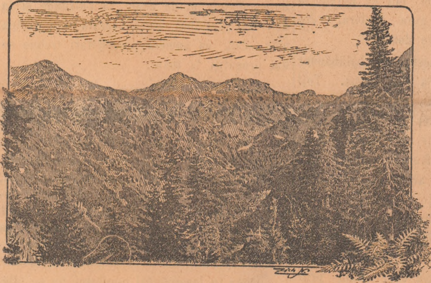
N e g o i u l

E lacul Bulea, in care se oglindesc copacii, cari il incunjoară, lacul Bulea ale cărui unde șopotitoare inpreună cu freametul frunzelor de copaci, cântă armonia dintre cer și pământ, dintre înălțimi și ape, — cari au inspirat poporului nostru doinele divine in care jalea, iubirea, dorul mândrii, și dragostea de libertate, voinicia, se 'ntrețes, ca razele de soare cu oglinda apei, — legând sufletul omenesc de acest măreț pământ de baștină al neamului românesc.