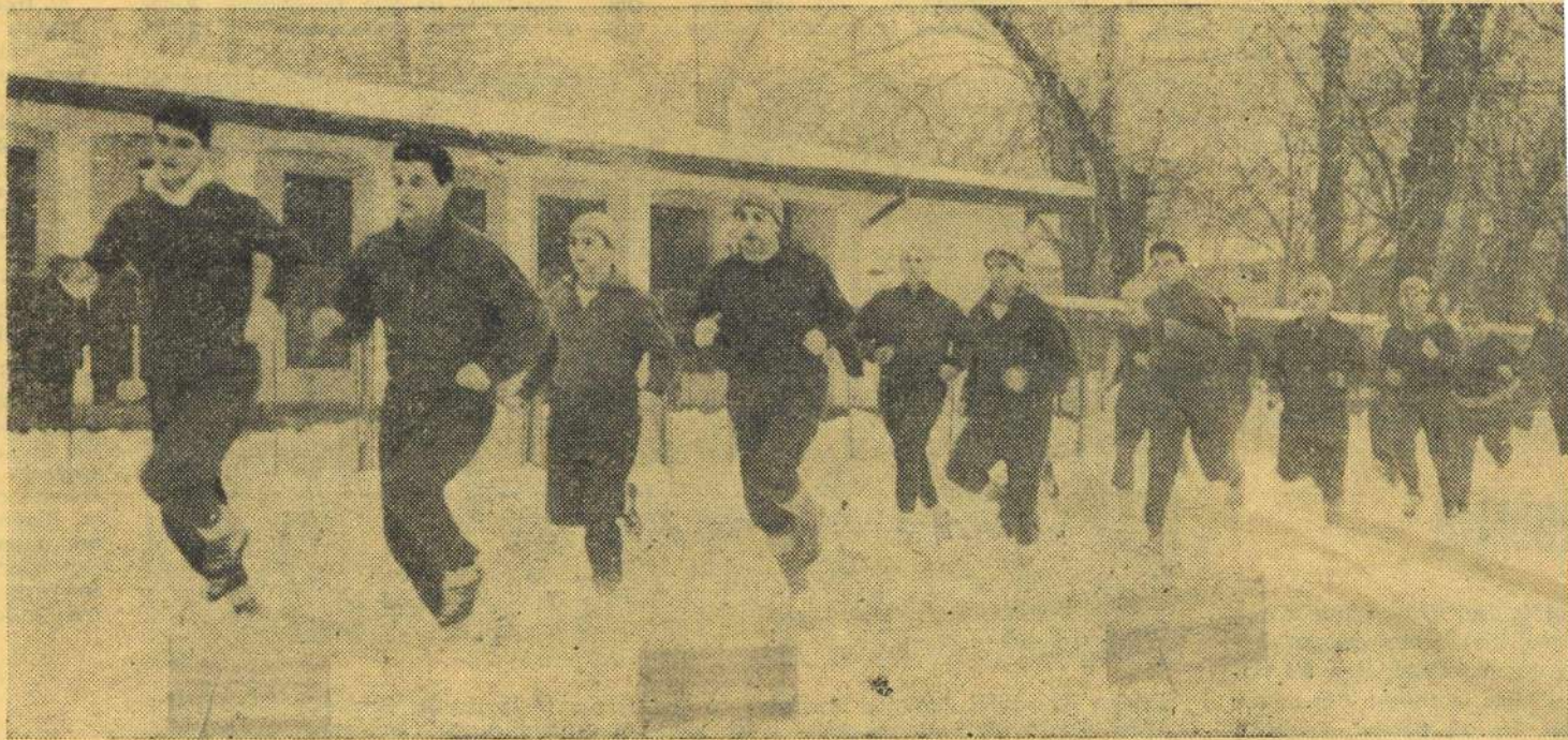
Echipa Progresul București la primul antrenament în aer liber în 1967

Trebuie moderat deosebire intensitatea derea obținerii unor adaptare a funcționii