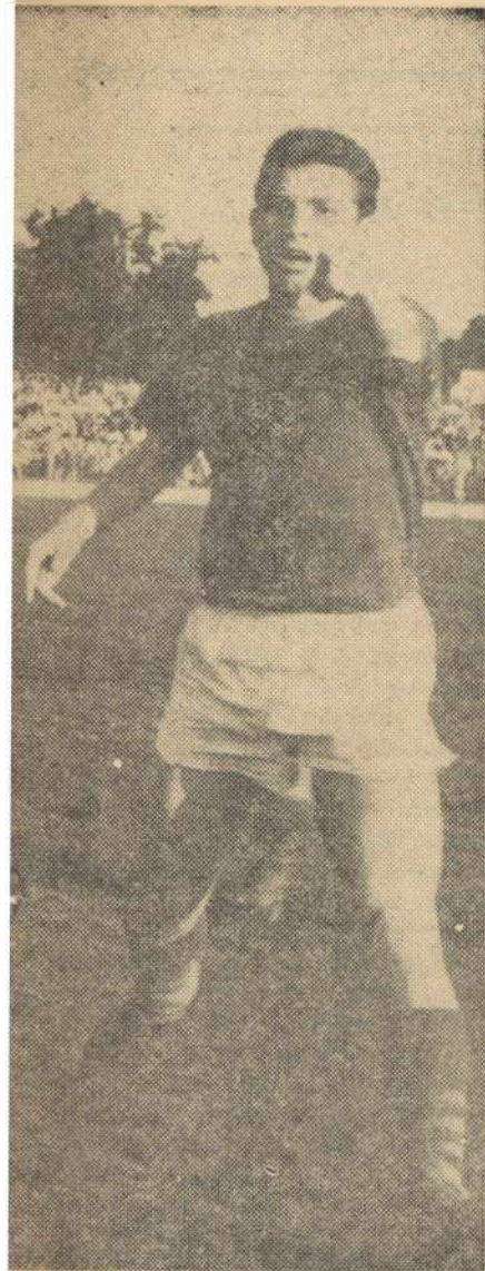
fie de fotbal a anului 1966", atri-DIALOG", în care arbitrul rămîne

portanța acestui meci, ca ultimă verificare înaintea campionatului Americii de Sud, arătînd că românii practică un fotbal de calitate, cu care uruguayenii au făcut cunoștință în primăvara la București. În cadrul aceluiași reportaje se subliniază frumoasa primire de care uruguayenii s-au bucurat în capitala țării noastre. În primul meci, echipa olimpică