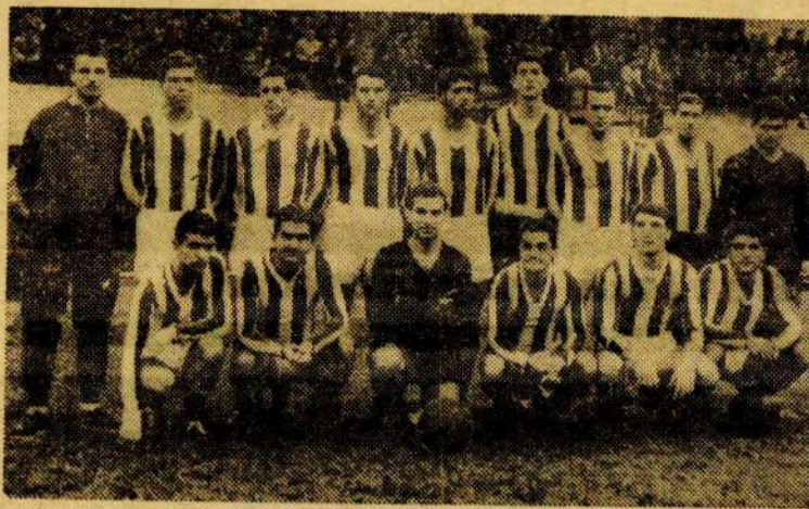
Echipa Metalul Plopieni, lider în seria Est a campionatului regiunii Ploiești

31 I — Goiânia: Palmeiras Sao Paulo — București 2-1 2 II — Belo Horizonte: Cruzeiro — București 1-1 4 II — Sao Paulo: Palmeiras — București 1-0 (întrerupt min. 65) 12 II — Itajuba: Yuracaua — București 2-3 14 II — San Lorenzo: Cutasuca — București 1-5. Au făcut parte din selecționata Bucureștiului jucătorii: Voinescu, Toma, Uțu — portari; Popa, Nunweiler III, Ionilă, Panalt, Stălcu — fundași; Nunweiler IV, Scredal, Jenel, Bone — mijlocăși; Pircălab, V. Anghel, Constantin, Ene II, Tircovnicu, Eftimie, Marcu, Tătaru — înaintași.