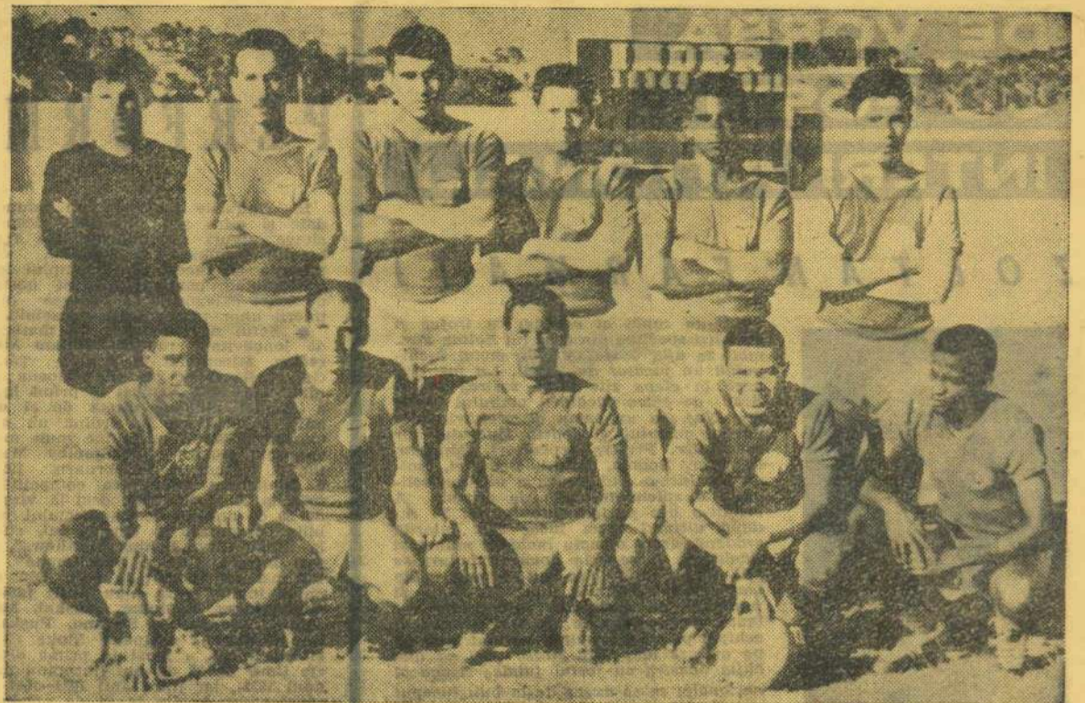
Echipa reprezentativă de fotbal a Cubei înaintea unei recente întâlniri internaționale.