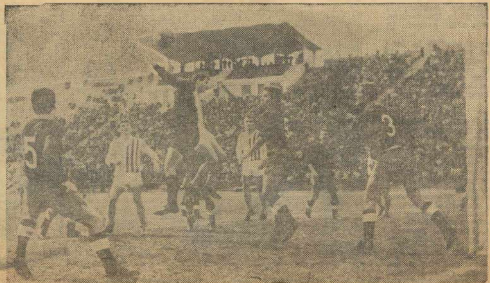
Pe frumosul stadion gălățean Dunărea, o fază din meciul Oțelul — Dinamo Bacău