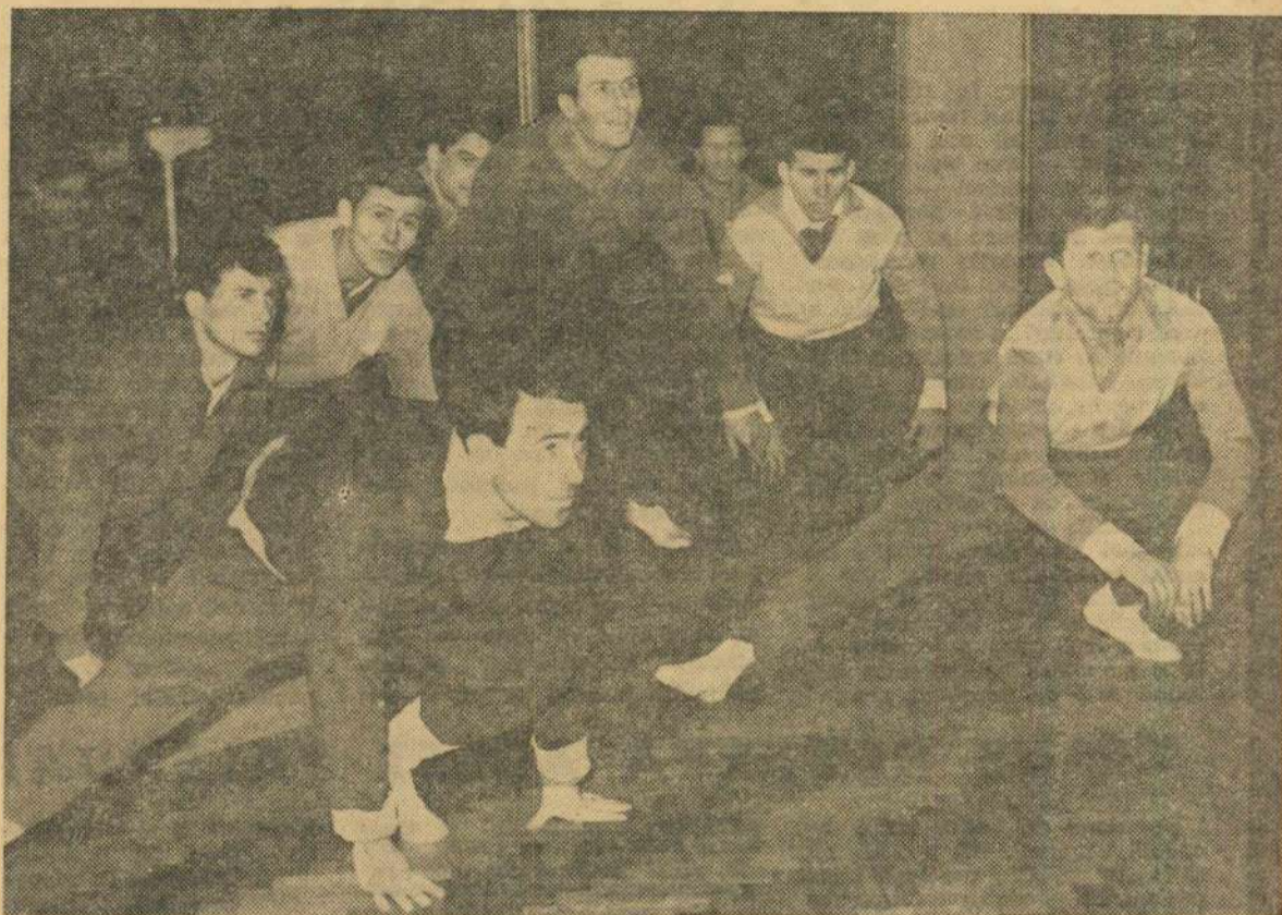
Jucătorii Rapidului fac, concomitent, antrenamente de sală și teren. Iată-l într-o ședință de gimnastică, în sală.

Nu începe nici o îndoielă, a început fotbalul... Publicăm mai jos, primele reportaje și informații de la antrenamentele echipelor: