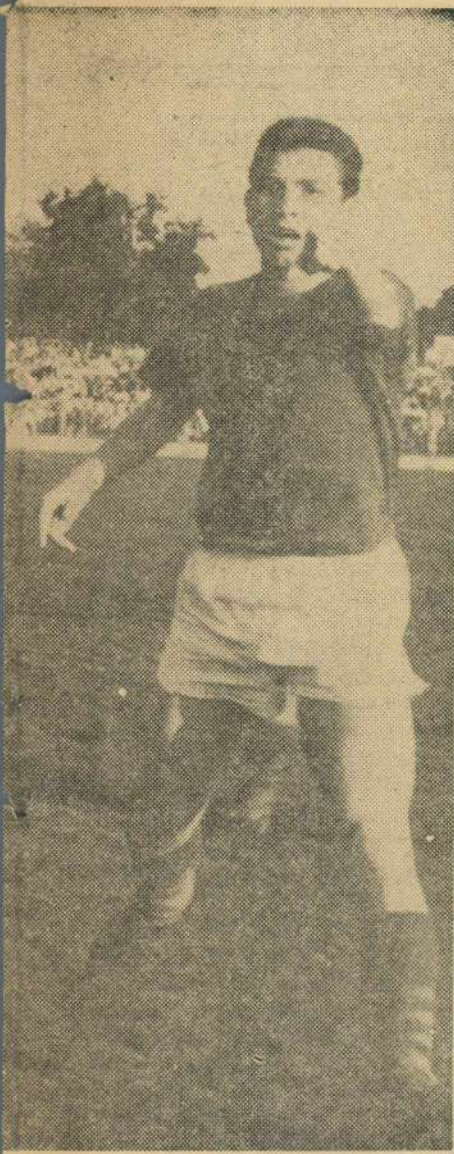
„Fotografie de fotbal a anului 1966”, atri-DIALOG”, în care arbitrul rămîne

portanța acestui meci, ca ultimă verificare înaintea campionatului Americii de Sud, arătînd că românii practică un fotbal de calitate, cu care uruguayenii au făcut cunoștință în primăvară la București. În cadrul aceluiași reportaje se subliniază frumoasa primire de care uruguayenii s-au bucurat în capitala țării noastre. În primul meci, echipa olimpică