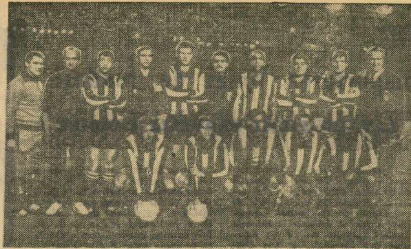
MADRID 1966: Echipa Penarol după cîștigarea meciului cu Real