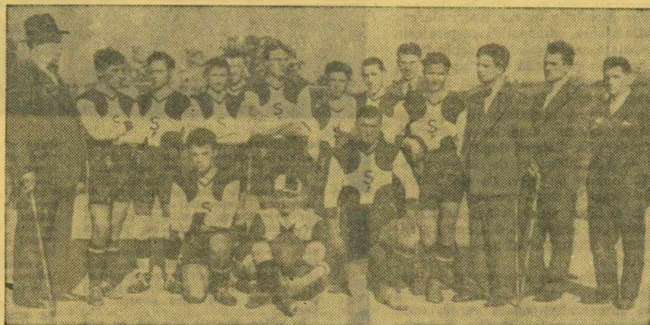
Echipa „Șoimii” în anul 1931

înaltul cerului. Sportul de bază însă era fotbalul.