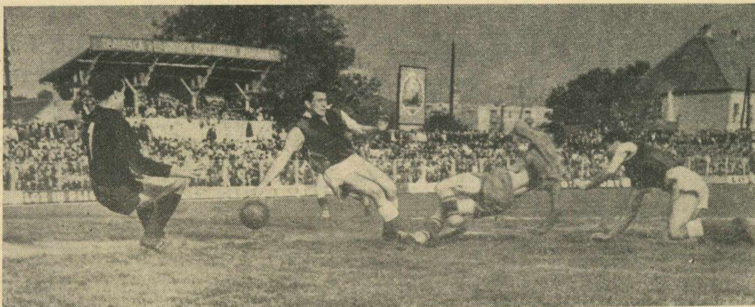
Aspect din meciul Crișul Oradea-Minerul Baia Mare (1-0): atacantul orădean Kun șutează printre Kromeli și Czako dar balonul va fi blocat de portarul echipei aaspe