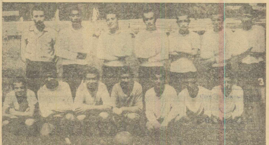
Echipa de fotbal a Casei de copii din comuna Siliștea (Roșiori) campioană regională

● Consemnări la încheierea primei ediții a campionatului școlilor generale ● Pe primul loc echipa din comuna Siliștea ● De ce au lipsit reprezentantele orașelor Giurgiu, Oltenița, Călărași și Roșiori...?