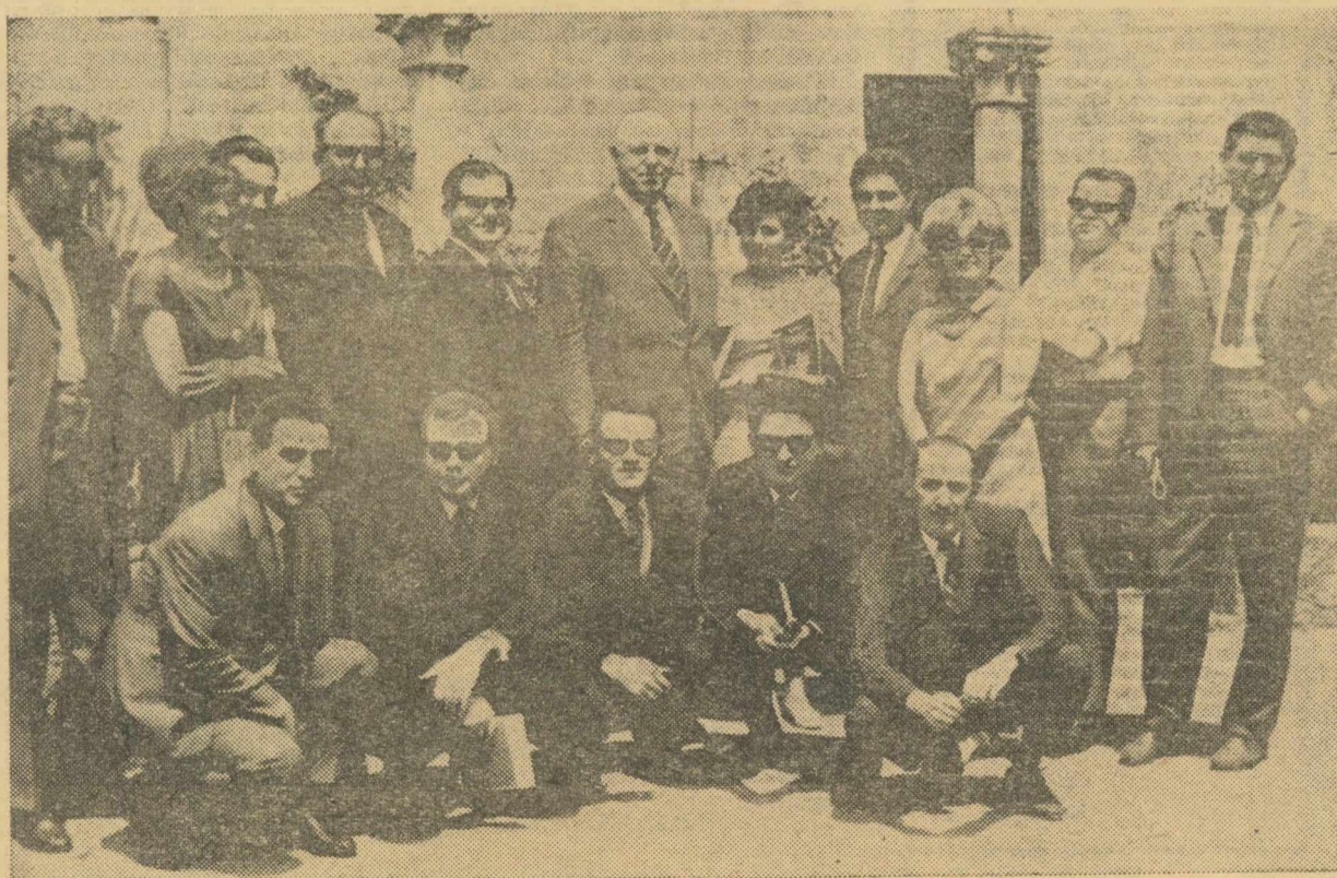
Președintele F.I.F.A., Sir STANLEY ROUS, în mijlocul unui grup de membri ai Asociației presei sportive române, cu ocazia conferinței de presă de marți, de la Uniunea Ziariștilor. Citiți amănunte în pagina 12.