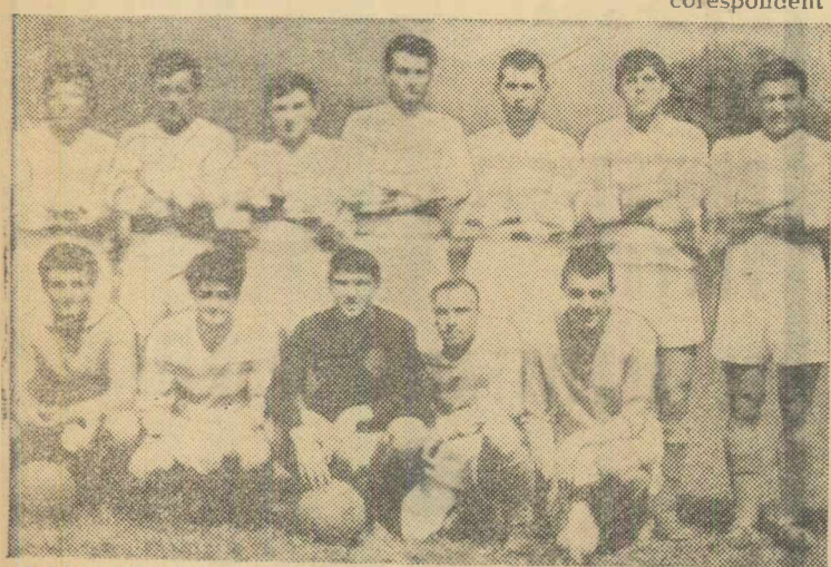
Echipa Minerul Fundul Moldovei campioană regională (Suceava)

Fluctuația mare de jucători, bijbițala, lipsa de seriozitate a conducătorilor secțiilor de fotbal participante la acest campionat rezultă și din numărul exagerat de jucători utilizați de-a lungul întrecerilor: Rapid 32, Fabrica de confecții 30, Voința Lemn 26, D.R.T.A. 24. Lipsuri serioase s-au semnalat și la capitolul disciplină. Comisia de resort a aplicat peste 20 de sancțiuni. Printre echipele „evidențiate” în acest sens se înscriu, deoc onorabil, D.R.T.A., Voința Lemn, Meteorul, Rapid și Ferarul. Întâ imaginea succintă a unei competiții fotbalistice lipsite de glorie, organizată probabil doar în virtutea obligațiilor comisiei orașenești față de litera regulamentului, situată la antipodul adevăratei sale meniri. Să ne mai mirăm atunci de ce fotbalul orădean se zbate de multă vreme în apele turburi ale mediocrității? V. SERE correspondent