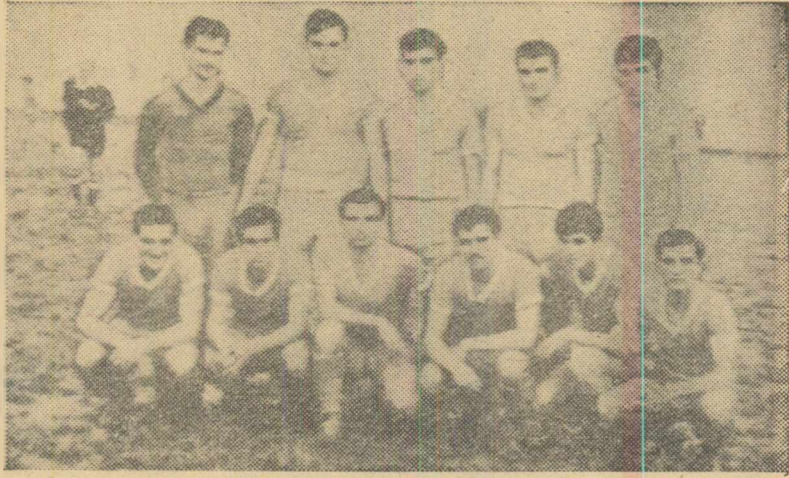
Echipa Postăvarul Brașov înaintea unui meci

fel încât POSTAVARUL Brașov a cucerit titlul de campioană orașenească. Echipa Postăvarul, de a cărei pregătire se ocupă antrenorul I. Schromm, a avut o comportare foarte bună în campionat, obținând 13 victorii din 14 jocuri susținute, cu un golaveraj edificator: 50-7. Acum, jucătorii echipei campioane a orașului Brașov efectuează pregătirile în vederea viitoarelor partide pe care le vor juca în barajul pentru promovarea în campionatul regional. C. GRUIA correspondent