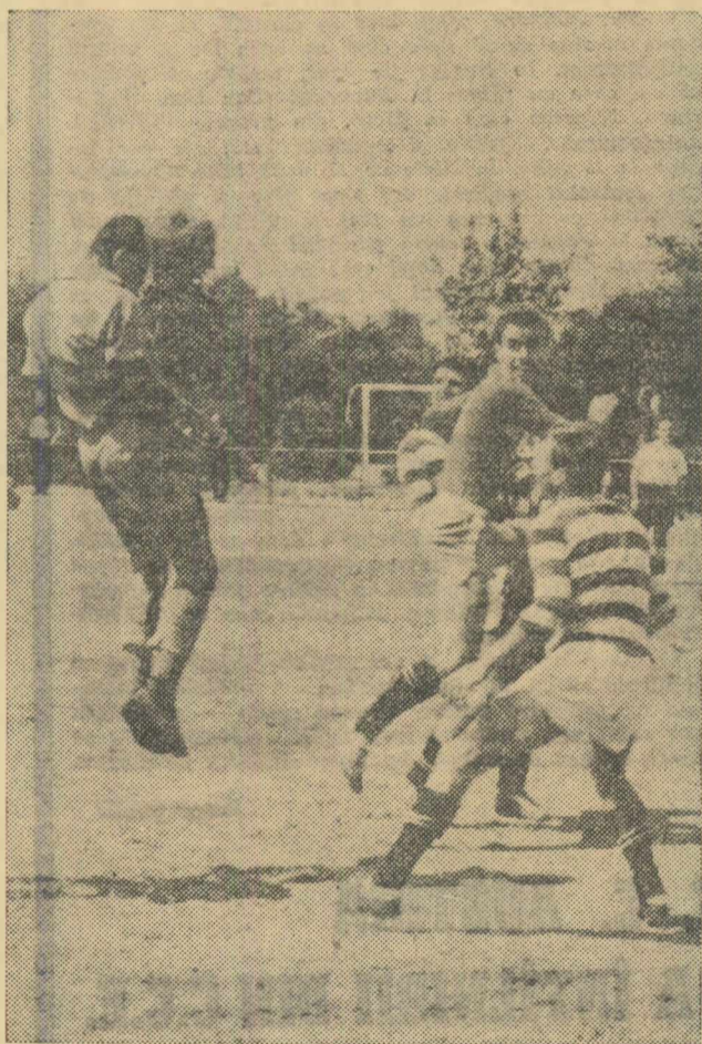
O probă că întrecerile finale din parcul „23 August” au fost foarte spectaculoase? Iată-o!

● Organizare exemplară ● Jocuri de calitate ● 30 de jucători propuși pentru tabăra republicană de juniori