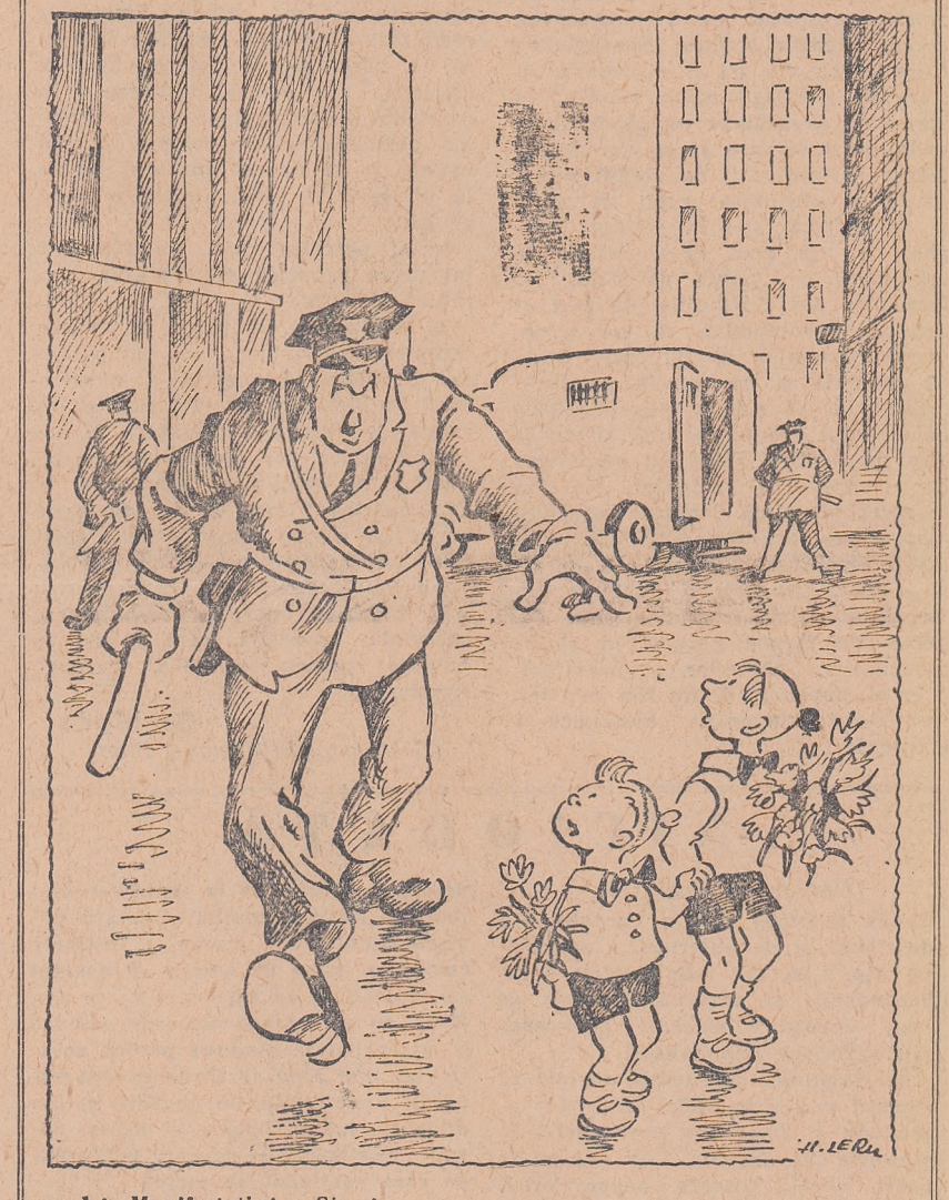
A1 Manifestație!... Stop! Desen de LERU