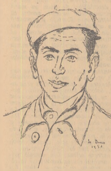
Desen de MEDI DINU