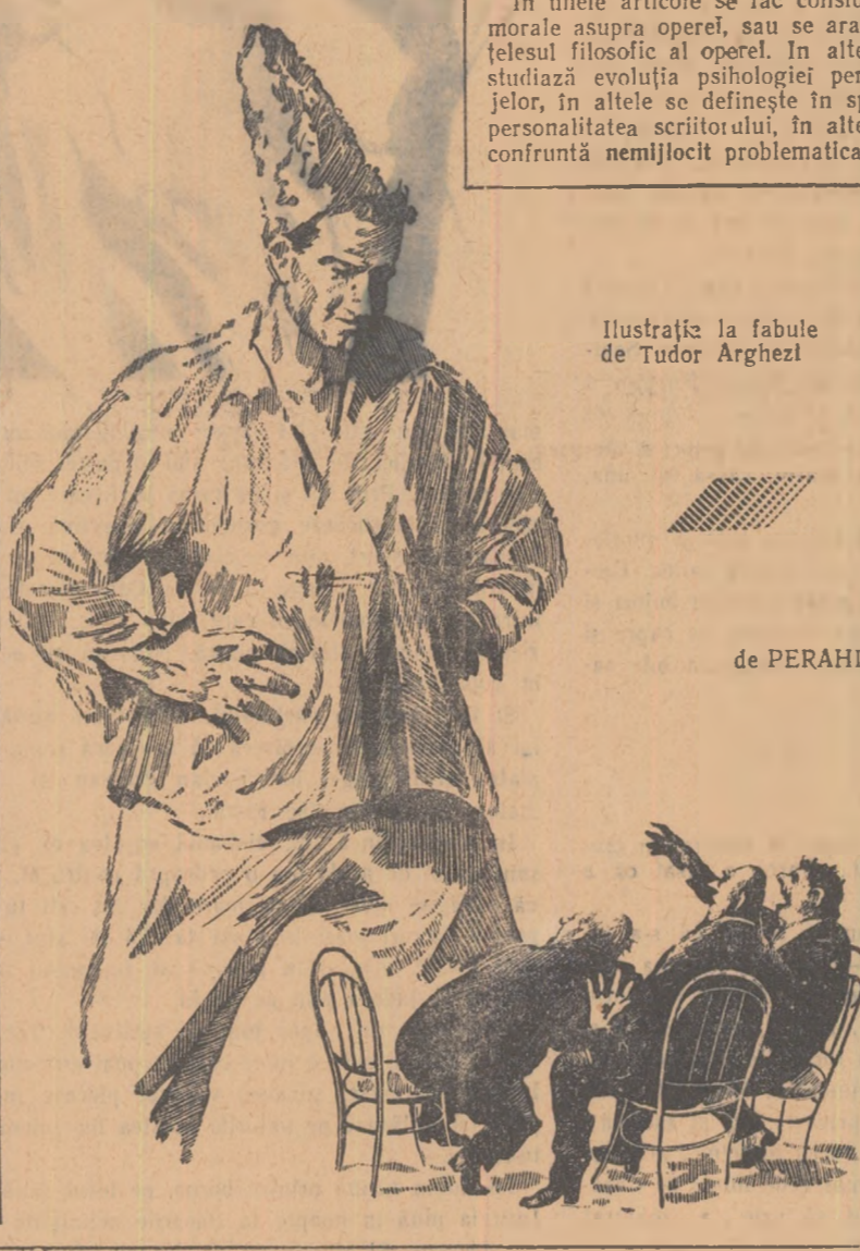
Ilustrază fabule de Tudor Arghezi