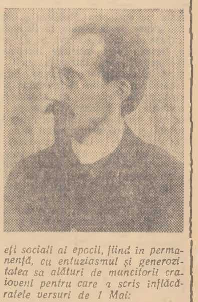
De la idealurile voastre, O, vizitatori flămânzi și goi, Vor răsarți ca niște aște Senine lumi cu oameni noi!

La 17 aprilie se împlinesc 60 de ani de când Traian Demetrescu n-a mai călcat pământ pe Calea Unirii din Craiova.