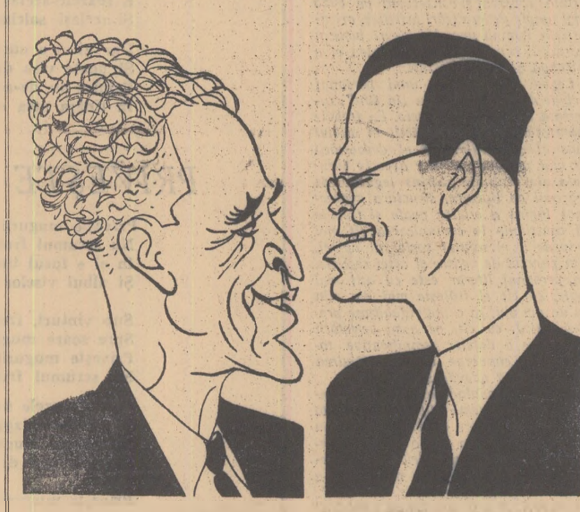
PETCO IVANOV ZADOGORSKI Pictor — R. P. Bulgaria VLADIMIR FIALO Profesor de istoria artelor la Universitatea din Praga — R. Cehoslovacă Desene de ROSS