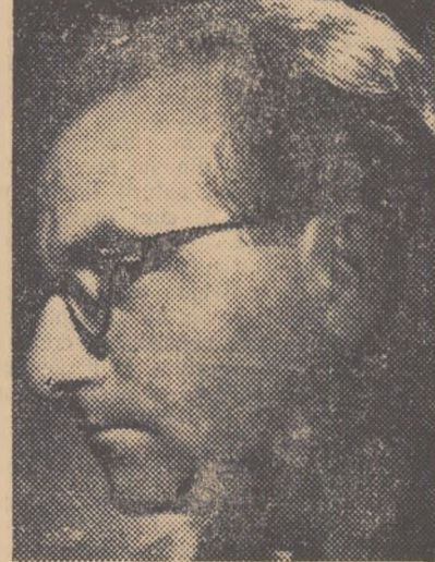
noasă; sint un trup și un suflet — ale opere literare, se înțelege. Dar, mai puțin bătăie de apă în puia deșpre fond și formă, în articolele așa-zise teoretice, și mai mult respect pentru adevărul vieții noastre socialiste.

După această mică paranteză, pe care le rog să n-o treci în interviu (lucru pe care, după cum se vede, nu-l fac!) vreau să spun că eu înțeleg prin măestrie, frumusețea fondui și a formei, îmbinarea lor armonioasă; sint un trup și un suflet — ale opere literare, se înțelege. Dar, mai puțin bătăie de apă în puia deșpre fond și formă, în articolele așa-zise teoretice, și mai mult respect pentru adevărul vieții noastre socialiste.