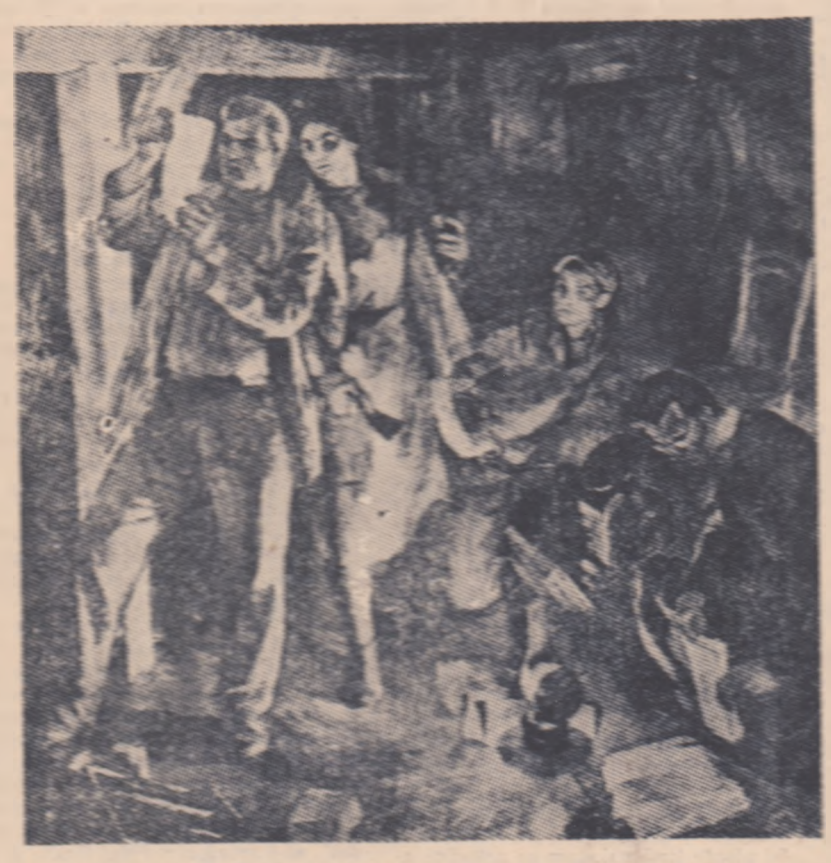
ȘTEFAN SZONTI Tipografia ilegală