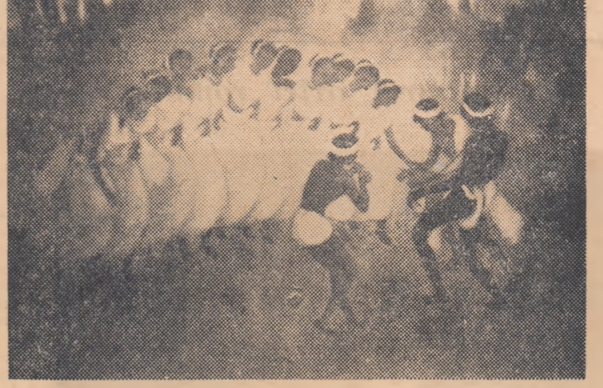
ANIL ROY CHOUDHURY