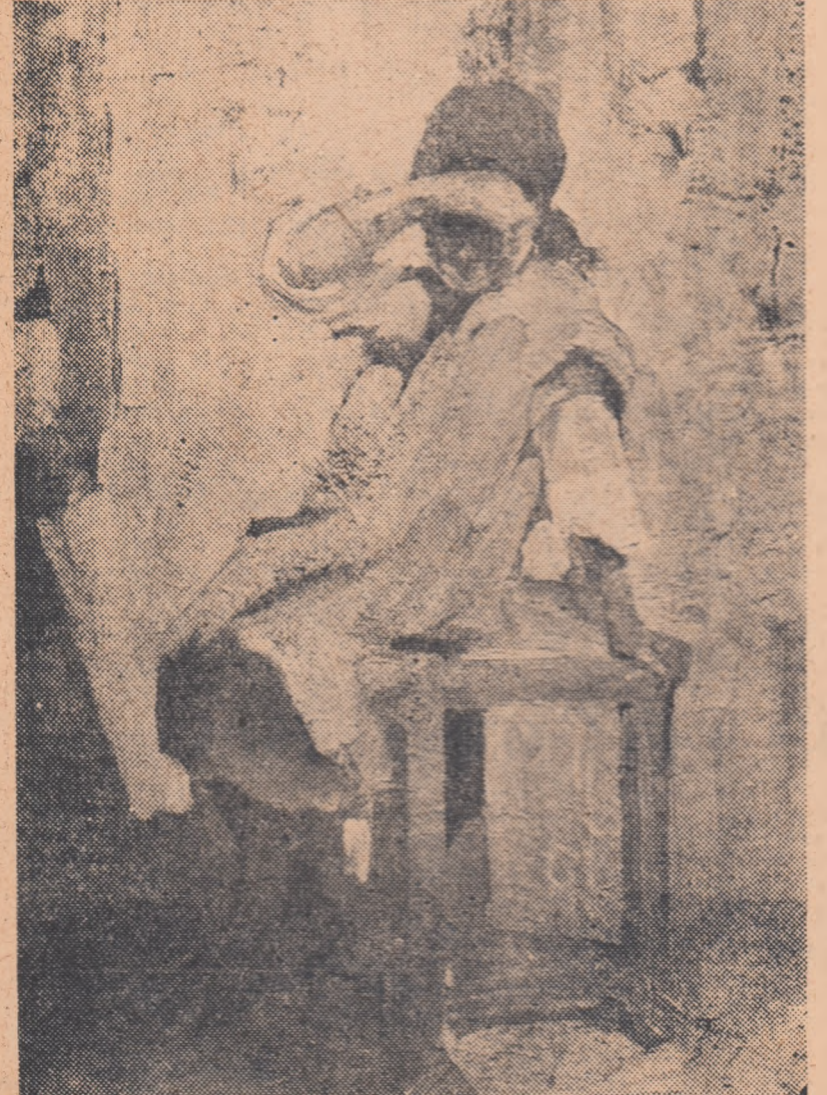
Fetiță în soare

Conrad, fiul, o găsi-ntr-o seară și-nclung cîți scrisoarea-amară... Pînea — mică. Și colba chiar, Iar hokeagul fumeaga arar.