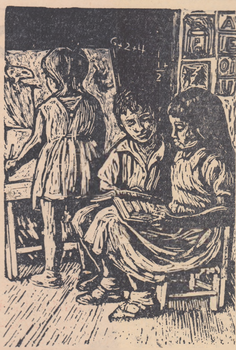
MARIANA YAMPOLSKY "Vrem scolile noastre" Expoziția de gravură mexicană

— Poate că cel mai frumos omagiu primit de André Chamson acum câteva luni, când a devenit membru al Academiei Franceze, a fost acela al muncitorilor din Saone, care i-a trimis următoarea telegramă: „Va rugăm să ne lăsați să împădurim cu dvs. și cu familia dvs. bucuriile nemuririi”.