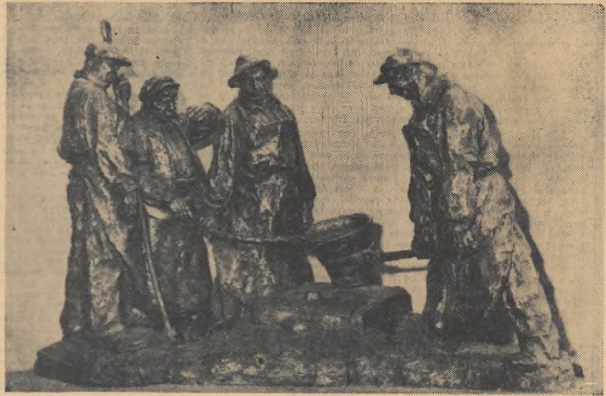
NAUM CORCESCU „La turnătorie” (ghips patinat)