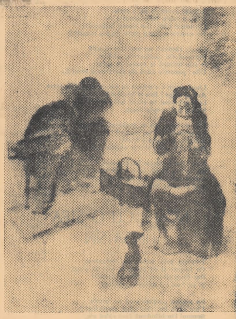
AUREL IJUIDI "Două lumi" (Expoziția interregională de artă plastică)