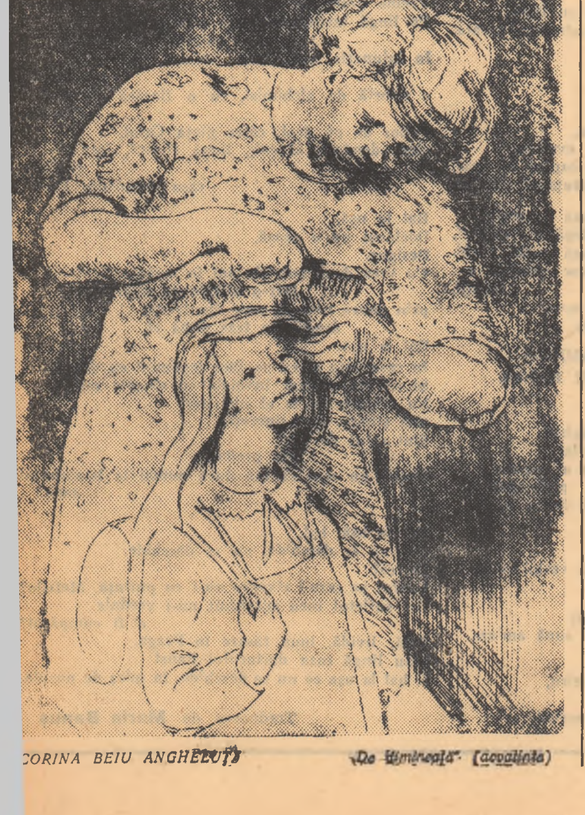
„De Simfonie” (Cocoșina)