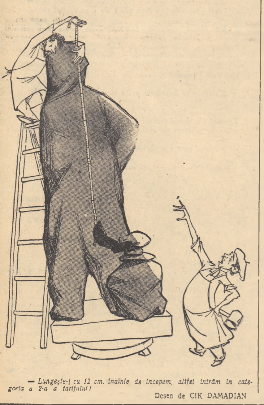
Lungește-l cu 12 cm. Înainte de începem, astfel intrăm în categoria a 2-a a tarifului!