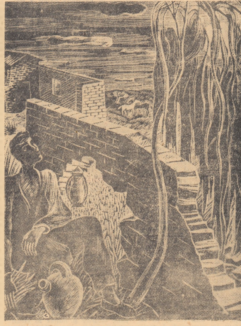
VICTOR REBUFFO (Din expoziția „Gravuri și desene din Argentina“)

„Actualități politice — 1851. La Napoli — cel mai bun dintre regi continuă să vegheze la buna ordinea din statele sale.“