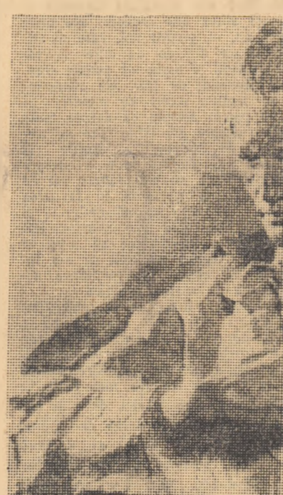
EMINESCU IN SPANIOLA