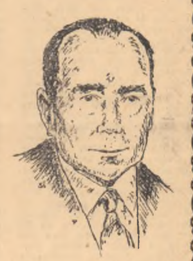
Desen de SILVAN

„Dacă pînă zilele trecute m-ar fi întrebat cineva ce știu despre Finlanda, as fi putut răspunde incomplet...“