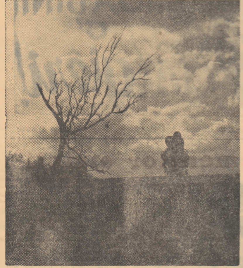
Scenă din film