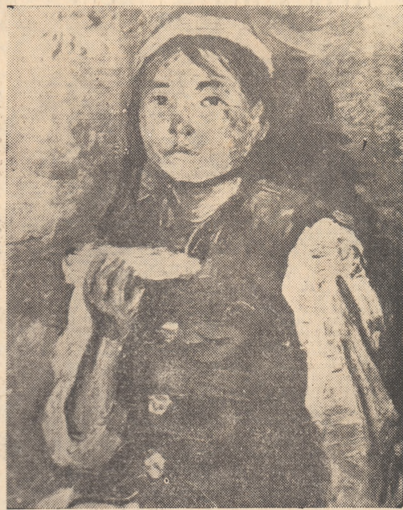
SEMION CIUKOV (U.R.S.S.)

Faptele arată că vigilența popoarelor lumii trebuie să fie trează pentru a împiedica uneltirile care se urzesc în continuare în culise la Washington sau Londra, pentru a ridica la un asemenea nivel indignarea și orbirea opiniei publice mondiale, încit imperialiștii să fie siliți să-și înceteze agresiunea în Orientul Mijlociu.