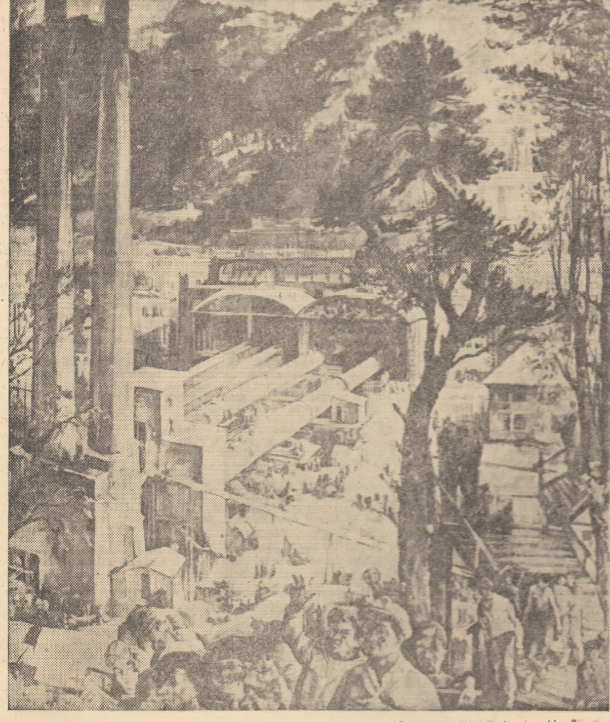
NAGY EMERIC „Construcția fabricii de ciment la Bicoz”