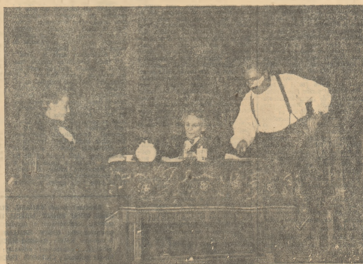
Scenă din actul II