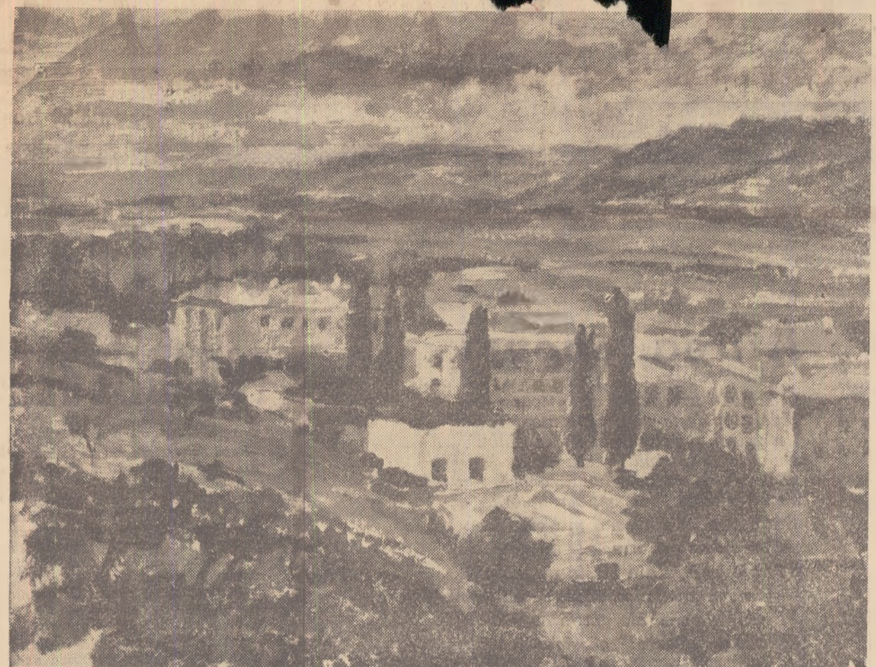
TENIȚA BULBUC GHIGA