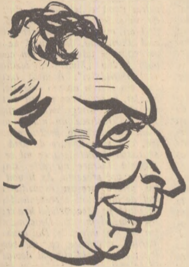
AUREL BARANGA nu ne-a mai dat, cam de mult, nici o piesă nouă

Cuțite, solniți, farfurie, Bulet modern, într-un cuvânt. Spunea odată c-o să fie Pe Marte harnica Marie. Așa doar, că pe pământ Tot ne mai lasă cînd și cînd Infometaji de poezie.