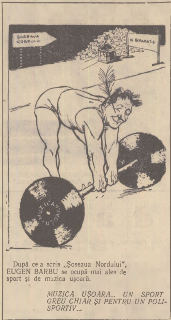
După ce a scris "Șoseaua Nordului", EUGEN BARBU se ocupă mai ales de sport și de muzica ușoară.