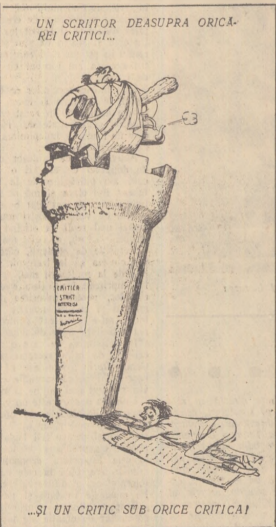
UN SCRITOR DEASUPRA ORICĂ- REI CRITICI...

"Sentimental ca Demostene" — spunea poetul, gînditor. Dar uși trecute definiții, cînd îl ascuți ca orator.