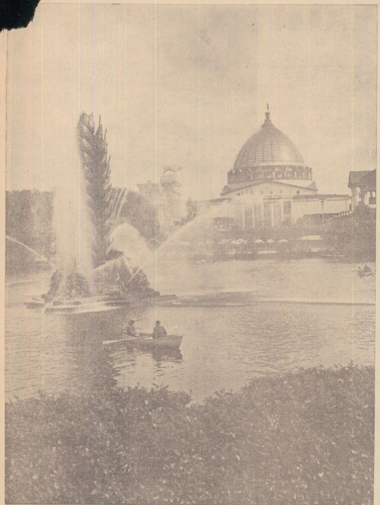
Aspect de la „Expoziția realizărilor economiei naționale” a U.R.S.S.