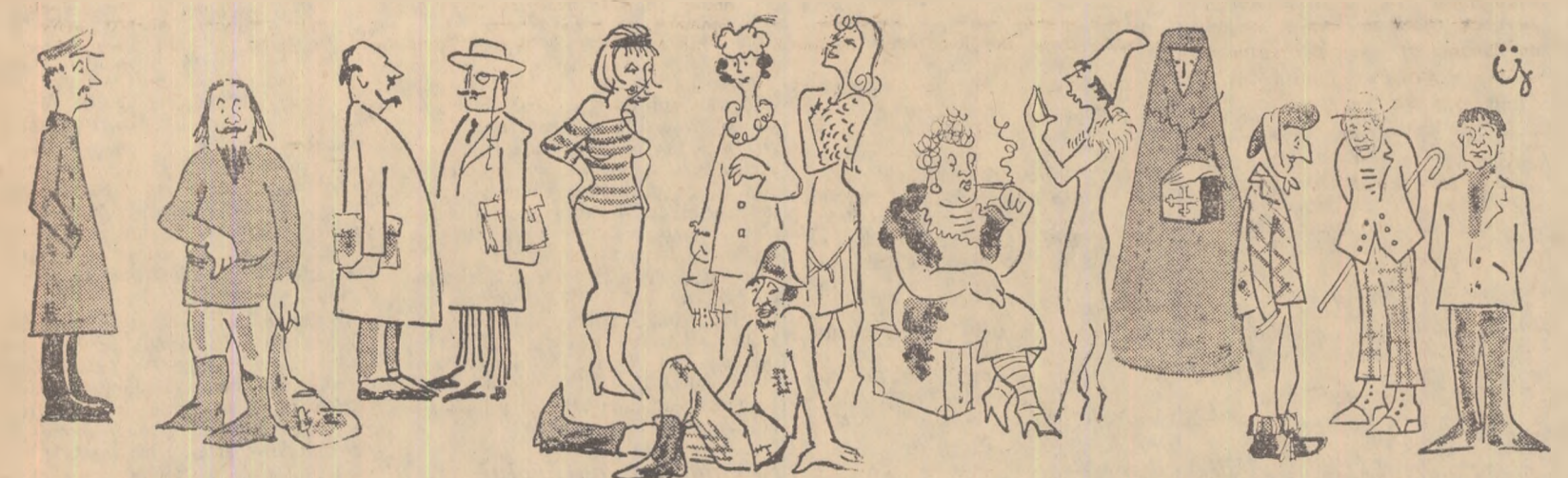
Desen de IONIȚA ITRUJ