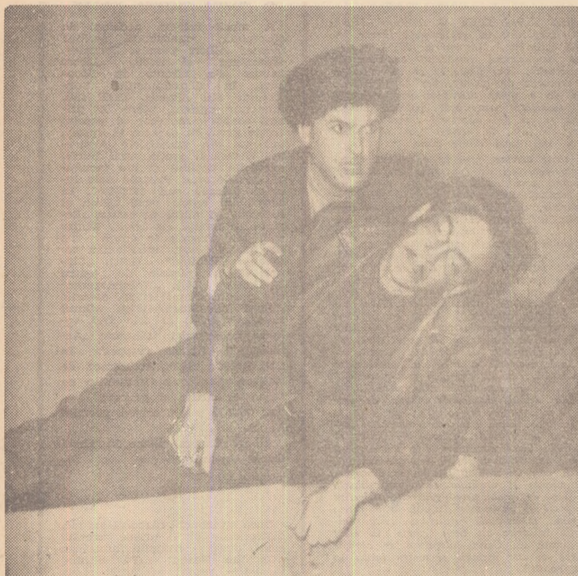
Scenă din piesa „Brigada 1-a de cavalerie” de V. S. Vișnevschi, la Teatrul „C. I. Notara” din Capitală