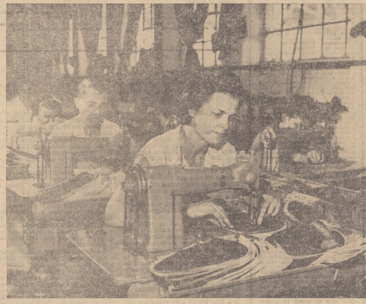
Secția de cusut jețe de la Întreprinderea „Flacăra Roșie” din Capitală.