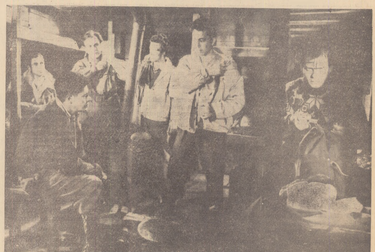
Scenă din filmul „Avalansa”