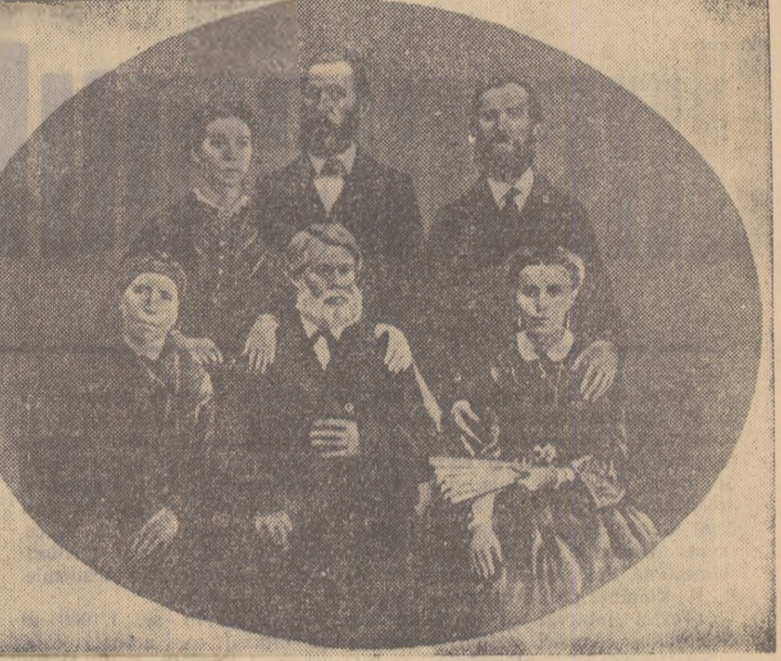
Familia lui A. P. Cehov