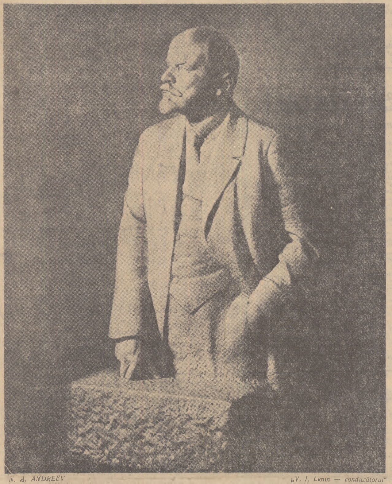
N. A. ANDREEV V. I. Lenin — conducătorul