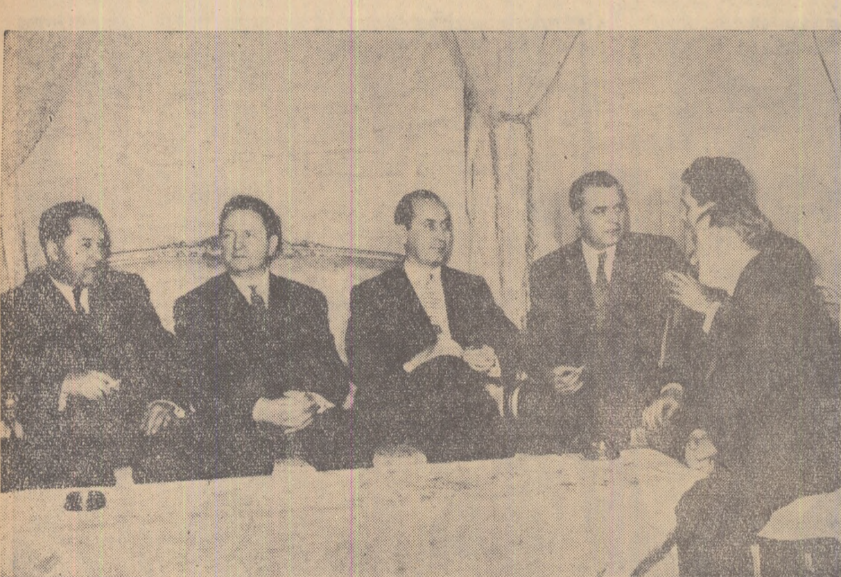
Aspect de la întîlnirea delegației scriitorilor sovietici cu scriitori romîni.

De astădată însă, în locul vagonurilor, personajele care așteaptă fără să știe ce sînt oamenii intoxicați cu droguri. De-a 27 de ani, am încercat toate stupefiantele, de la heroină pînă la psilocibină — mai mulți profesori din Noua Anglia au calificat piesa, „un abecș pe corpul societății noastre”, iar criticul din „New York Times” a denumit-o: „Un simplu morman de gunoi”.