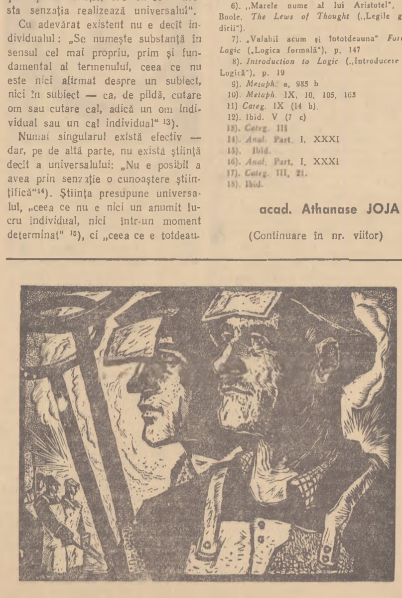
GII. IVANCEVO „Ojelari“